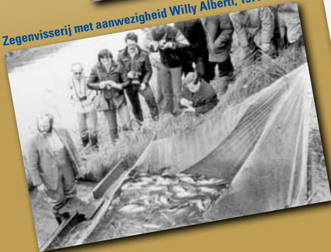
Zegenvisserij met aanwezigheid Willy Alberti, 1975.