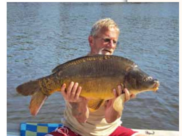
Spiegelkarper van 16 pond. Gevangen in Brabantse Biesbosch.