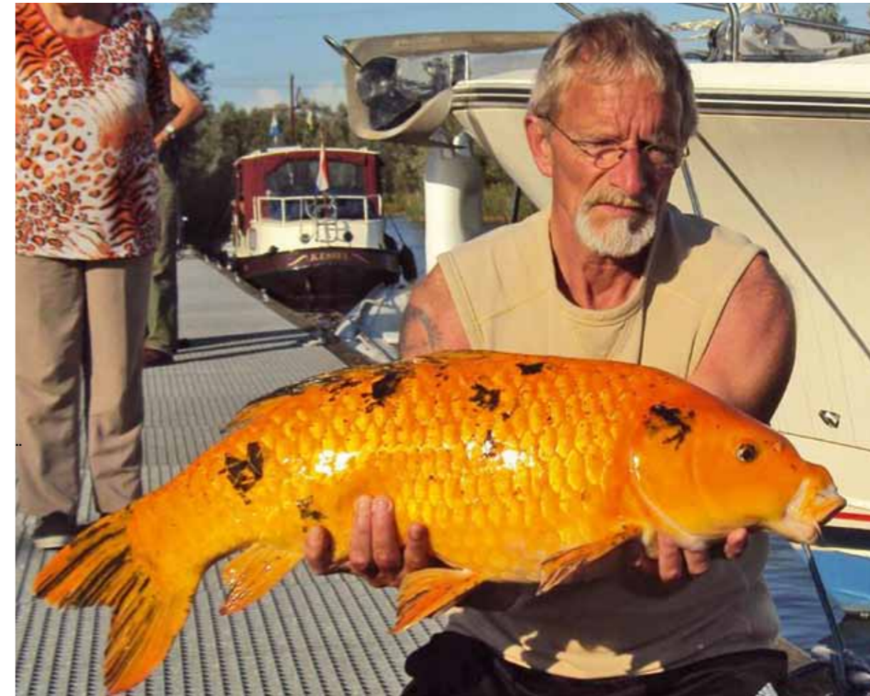
De gouden koi-karper van 20 pond, gevangen in de Brabantse Biesbosch.

Ik ben in juli met mijn boot 'n week naar de Biesbosch geweest. Ik had al vaak over het natuurgebied gehoord en wilde er graag eens gaan vissen. Ik legde aan in 'n gebied Aakvlaai geheten. Het is een prachtig natuurgebied, op de late avond als de sche-