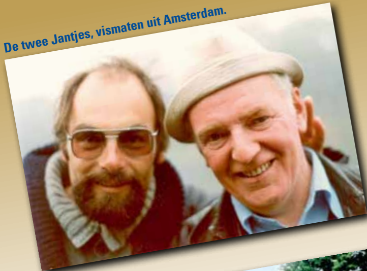
De twee Jantjes, vismaten uit Amsterdam.