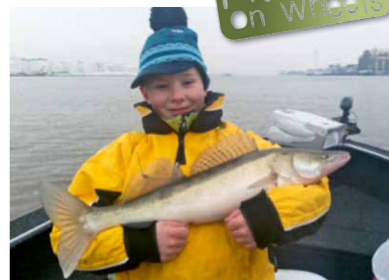
*** Mooie snoekbaars op het Noordzee Kanaal.

www.fishingonwheels.nl info@fishingonwheels.nl Telefoon 06-15047162