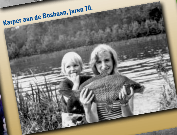
Karper aan de Bosbaan, jaren 70.