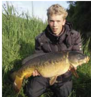
Er zwemmen zelfs spiegels!

Om dit te bepalen pak ik mijn fiets en ga fietsen door de buurt in de hoop in één van de vele wateren in Amsterdam-West wat te zien. Net als karpers zijn mensen ook 'gewoonte dieren', dus ook ik fiets eerst langs mijn vertrouwde en bekende plekken om te kijken of ik daar wat zie. Ik zie een paar vissen in de zon liggen op een ondiep stuk, maar ik besluit toch nog verder te kijken op andere wateren. Dan, tijdens