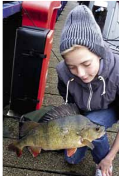
Een 'baksteen' van een baars!

Ik gebruik dus de dropshotmontage, daarbij zit de haak met de shad dus boven het loodje. Volgens mij de meest voor de hand liggende techniek voor het vissen in de bebouwde kom vanwege de vele obstakels in het water, denk aan fietsen, winkelwagentjes etc. Doordat je niet snel vast komt te zitten, kan je dus wel in de buurt van deze obstakels vissen en vaak 'liggen' de roofvissen daar juist te wachten op een hapje! Je gooit eenvoudigweg in en vist,