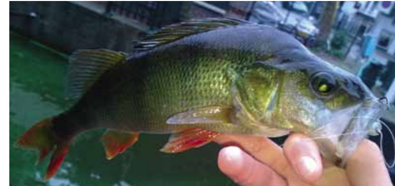
De mooiste zoetwaterroofvis!

Maar goed, allemaal leuk en aardig, er zijn natuurlijk wel bepaalde eisen waar het materiaal aan moet voldoen. Er is veel mogelijk op het gebied van dropshotten, maar de volgende materialen zijn essentieel. Met dropshotten gebruik ik ten eerste een speciaal voor het dropshotten ontwikkelde hengel. Deze hengel heeft een strakke ruggengraat en een goede body om de haak te zetten, maar is flexibel in de top zodat ieder tikje en elk bultje of kuiltje geregistreerd wordt. Een kleine molen in de 1000-serie met een lichte gevlochten lijn is ook fundamenteel. Waarom een gevlochten lijn? Gevlochten lijn bezit geen rek, nylon wel, zo heb je dus meer contact met de bodem en uiteindelijk met de vis. Heel belangrijk is ook de onderlijn, deze is van fluorcarbon. Fluorcar-