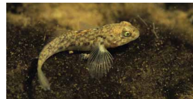
Zwartbekgrondel Sloterplas