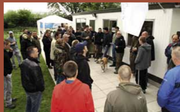
Aan de organisatie lag het niet