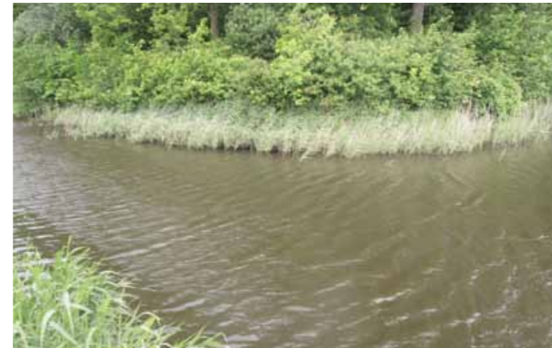
Nieuw water, nieuwe kansen!

mijn fietstocht, kom ik langs een water bij mij in de buurt. Ik wist wel dat het er lag, maar het leek me nooit interessant en ik wist ook niet wat er zwom. Nu ik er langs fiets zie ik opeens een paar vissen in het riet bezig. Ik stop en ik blijf kijken en het blijkt dat de vissen begonnen zijn met paaien. Mooi!, denk ik, omdat de vissen zich nu goed laten zien, is het ook een uitstekende kans om te kijken wat er in dit water rondzwemt. Ik loop rustig langs het water en ik kijk goed. Ik wist wel dat er wat karper zwom, maar er blijkt veel meer vis te zitten dan ik in eerste instantie dacht. Ik zie zelfs een paar spiegels zwemmen. Ook het water zelf, met daaraan vast het slotenstelsel, blijkt na onderzoek veel groter te zijn dan ik dacht. 'Zou het dan toch de moeite waard zijn?' denk ik. Een paar dagen later ben ik terug met een peilhengel om te kijken hoe diep het is en waar ik wel en niet kan vissen. Met het vissen zelf wacht ik uiteraard tot na de paai omdat de vissen het nu druk hebben met andere zaken. Na het peilen blijkt de sloot vrij ondiep te zijn met een zachte bodem. Daarbij zijn er veel obstakels zoals takken en riet in het water en is er dus weinig ruimte om de vis te drillen. Ik zal