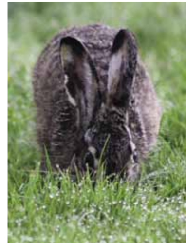
Zoef komt dichterbij

Ik pak weer in en fiets verder op zoek naar een nieuwe plek. Ik kom bij een duiker waar ik al eerder heb gevist en besluit ook hier te voeren. Dit plekje is echt een hotspot! Er ligt namelijk een kuiltje naast de duiker die onder de weg door loopt. Hier verzamelt zich altijd wel wat vuil en drie maal raden wie daar wel eens langs zwemt om te kijken of er wat eetbaars tussen ligt? Dus wat kruim in het kuiltje en een handje er omheen. Het wegdek boven de duiker verbindt de weg met een stuk weiland waar aan de rand struiken en bomen staan. Ik heb het idee dat er vroeger een huis heeft gestaan en dat dit de overblijfselen zijn van wat ooit was.