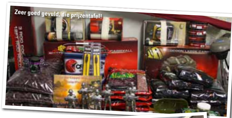
Zeer goed gevuld, die prijzentafel!