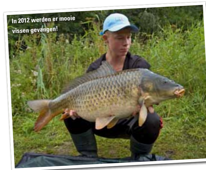
In 2012 werden er mooie vissen gevangen!