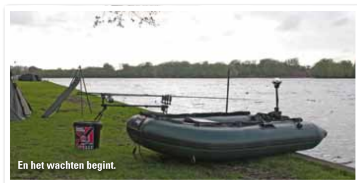
En het wachten begint.