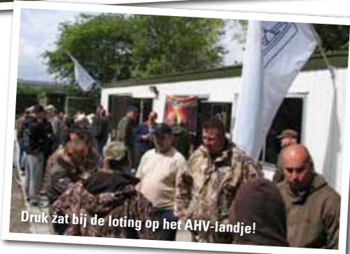
Druk zat bij de loting op het AHV-landje!