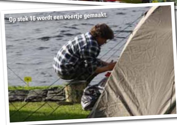
Op stek 16 wordt een voertje gemaakt.