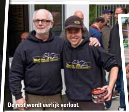
De rest wordt eerlijk verloot.