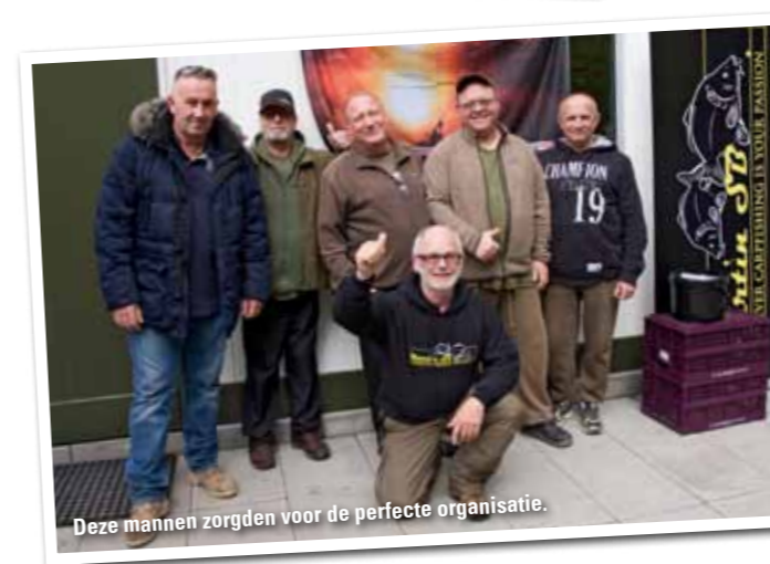
Deze mannen zorgden voor de perfecte organisatie.