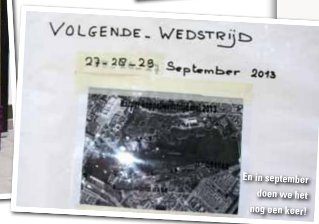
En in september doen we het nog een keer!