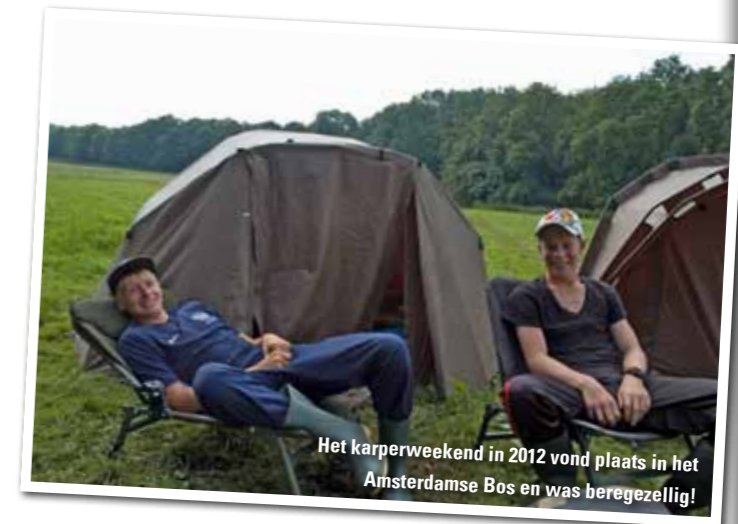
Het karperweekend in 2012 vond plaats in het Amsterdamse Bos en was beregezellig!

Wanneer? Van vrijdag 9 augustus tot en met zondag 11 augustus in de BIJLMERWEIDE Hoe laat? Vrijdag beginnen we om 16.00 uur en zondag om 10.00 uur is het afgelopen Voor wie? Aspirant-leden van 12 t/m 18 jaar Wat kost het? € 5,00 Dit geld overmaken op de rekening van de AHV, ING 117917 onder vermelding van: KARPERWEEKEND AUGUSTUS, je naam en je lidnummer Aanmelden? Stuur een mailtje naar ahv@ahv.nl met daarin je naam, adres, geboortedatum, telefoonnummer, lidnummer en natuurlijk KARPERWEEKEND AUGUSTUS