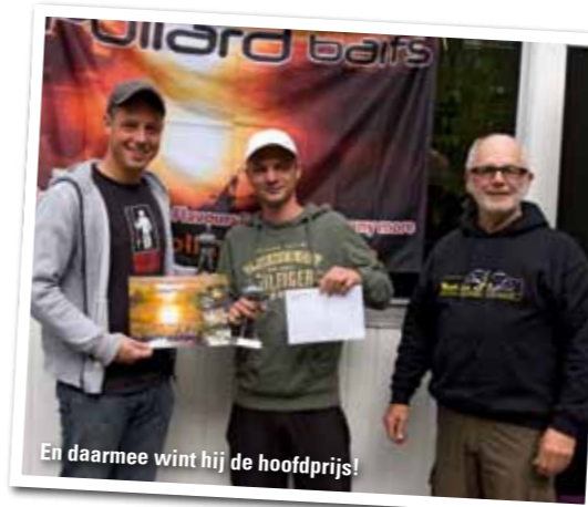
En daarmee wint hij de hoofdprijs!