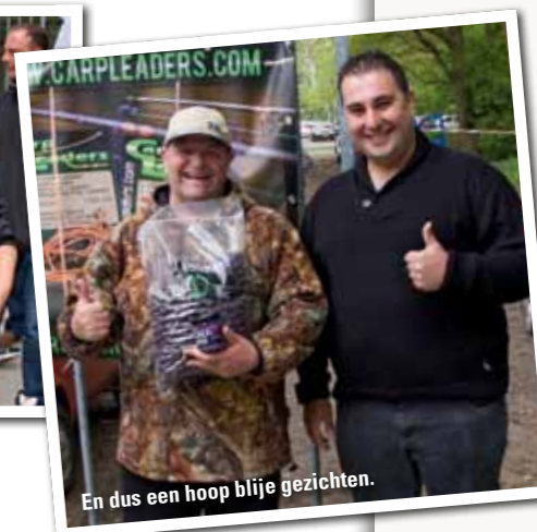
En dus een hoop blije gezichten.