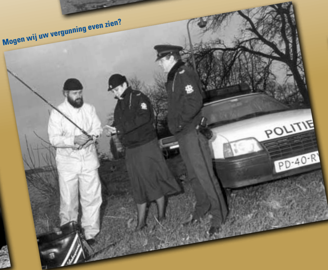
Mogen wij uw vergunning even zien?