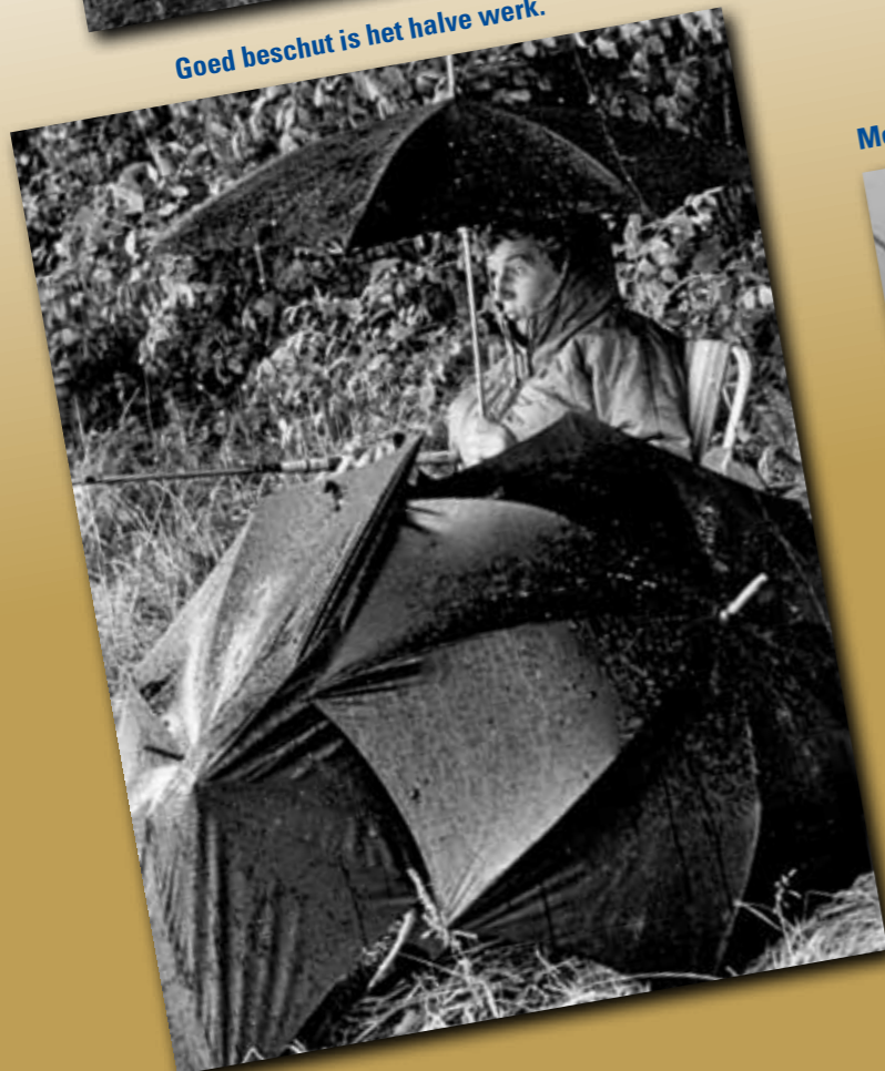
Goed beschut is het halve werk.