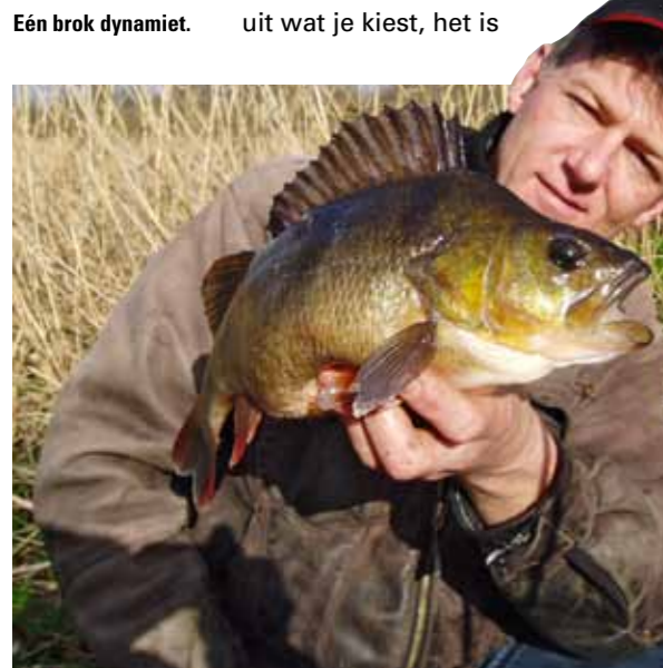
Eén brok dynamiet.