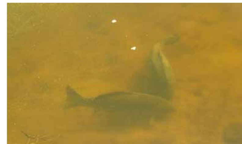
De schub en de spiegel.