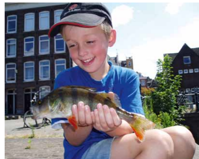
Zo vader, zo zoon.

In stapjes van 10 jaar vanaf mijn derde. Ik herinner me er helemaal niets meer van maar ik heb foto's van mijzelf, zonder voortanden, met een baarsje in mijn hand. Het arme ding zal het niet lang gemaakt meer hebben na die ontmoeting met mij gezien het wit van mijn knokkeltjes. Een bamboestok, dik draad, baarsdrijvers, kogelloodjes, een forse haak en een dikke worm. Toen het recept voor succes en nog steeds! Mijn dertiende verjaardag vier ik in de Bijlmer en ik krijg een werphengel. Een snoekbaarshengel van 2.70 meter lang. Snoekbaars? Wat is dat nou weer? Ik wil baars. Bij Peeters koop ik een