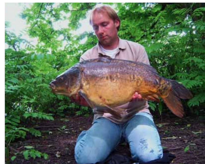
Tussen de rotzooi vandaan 'geplukt'.

Een tijdje gebeurt er niets. Ben ik opgemerkt? Is de vis verder gezwommen? Altijd die twijfel. Dan eindelijk toch weer een teken. Drie happen in het vuil, naast de plastic tas. De vis koerst op de rand af, te zien aan het soms bewegende drijfvuil. Een donker-grijze kop breekt naast een korst door het vuil, niet ver van de korst met de haak. Heel geniepig verdwijnt het stuk brood onder water. Het ontstane gat in het vuil sluit zich. Twee oudere mannen houden halt op de brug en zetten hun armen op de leuning. Concentreren nu. Wat blaadjes naast mijn korst draaien. Even later wijkt het flesje en omsluiten dikke lippen geruisloos mijn korst. Mijn lijn kruipt over het vuil, het baarsdrijvertje komt in beweging. Nu! Ik sla aan en tegelijkertijd sta ik op en vlucht de vis van me af. De dril trekt nogal wat aandacht van passanten. De twee brugleuners komen polshoogte nemen. 'Karper zeker hè?' zegt de grijscharige van de twee. Ik antwoord bevestigend. 'Heb je hulp nodig?' De man heeft de schepnetsteel al in zijn hand. Een paar minuten later tillen we gezamenlijk de vis op de kant en op het onthaakmatje. Een