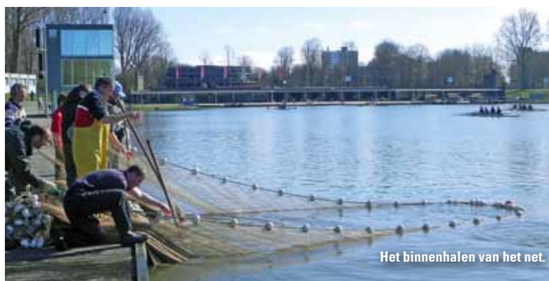
Het binnenhalen van het net.

Op 25 maart 2012 hebben de Karpercommissie en de Commissie Waterbeheer gezamenlijk een visstandbemonstering gedaan op de Bosbaan. De Bosbaan is een landelijk bekend viswater, weliswaar niet altijd bevisbaar omdat het vooral ook een roeibaan is, maar toch. Jarenlang was de Bosbaan het paradepaardje van de AHV. Amsterdamse vissers genoten (en genieten!) dagelijks van de grote karperspopulatie en ook de sociale contacten aan de 'Baan', mogen niet onderschat worden. Vissers van ver buiten Amsterdam weten eveneens hun weg naar de Bosbaan te vinden. Zij worden speciaal lid van de AHV om er te mogen vissen. De Bosbaan is een heus karpersparadijs voor velen. Toch is er een schaduwzijde aan deze intensieve bevissing. Iedereen heeft wel eens verhalen gehoord over karpers met beschadigde bekken, sommigen hebben die zelfs gezien. Reden voor het Bestuur om maatregelen te treffen. De regels in het kort: