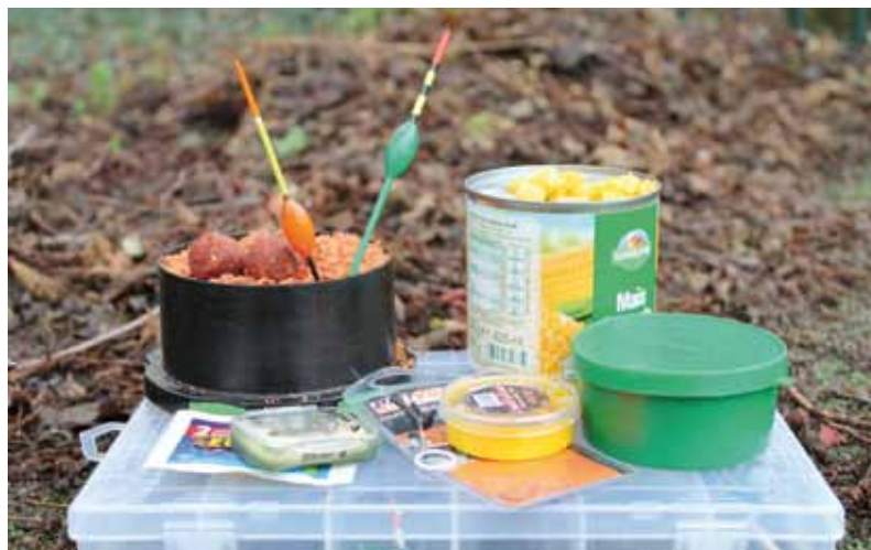
Bijna alle spullen die ik nodig heb voor in de winter; maïs, maden, penspulletjes en mini-boilies

In de winter vis ik graag mobiel met de penhengel. Rietkragen en kademuren zijn zo makkelijk af te vissen en ik blijf warm door van plek naar plek te struinen. Let eens op waar de eendjes in de winter gevoerd worden, die beestjes morsen nogal wat brood dat naar de bodem dwarrelt, driemaal raden wie daar vaak liggen te