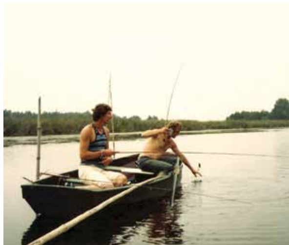
Slapend vangen gaat prima!

Eind jaren '70, pennen op snoekbaars in Vinkeveen