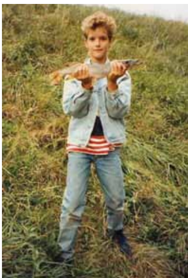
Opeens waren zelfs de snoeken niet meer interessant!

karpers min of meer afhankelijk zijn van boilies (denk aan extreem voedselarme en/of overbezette wateren), het belang en effect van gezond voer nog groter is dan op wateren waar voldoende natuurlijk voedsel te verkrijgen valt en boilies meer als een tussendoortje dienen.