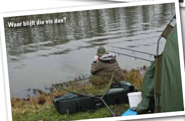
Waar blijft die vis dan?

De volgende karpervedstrijd vindt plaats op 18, 19 en 20 april 2014 op de Sloterplassen en betreft een koppelwedstrijd. Voor meer informatie, Herman Sentrop: 06 - 55 85 49 06