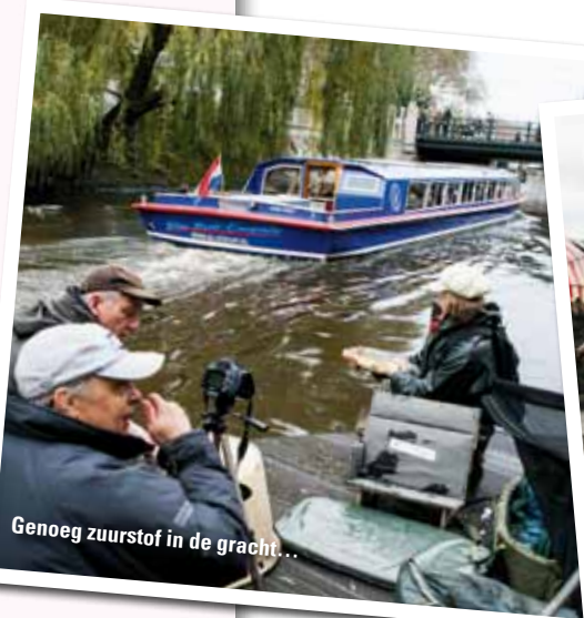
Genoeg zuurstof in de gracht...