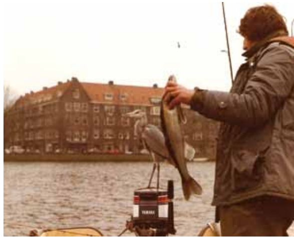
De Westlandgracht in de jaren '80