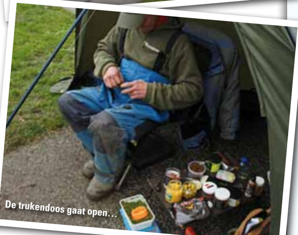
De trukendoos gaat open...