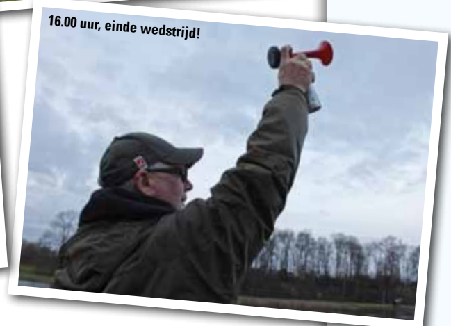
16.00 uur, einde wedstrijd!