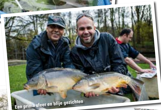
Een prima sfeer en blijde gezichten