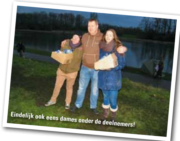
Eindelijk ook eens dames onder de deelnemers!