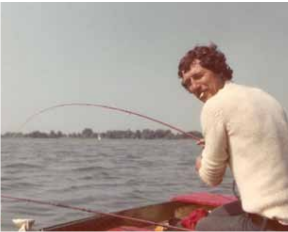
De pen schuift weg, aanslaan, hangen!