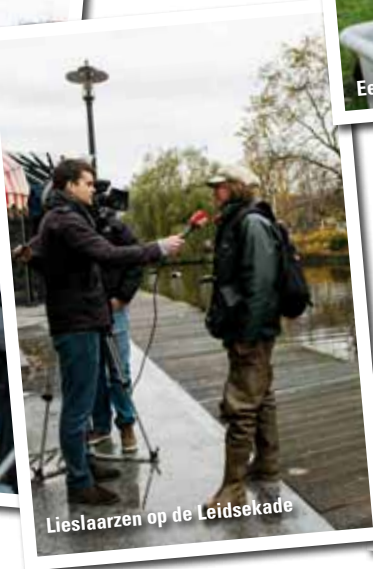
Lieslaarzen op de Leidsekafe