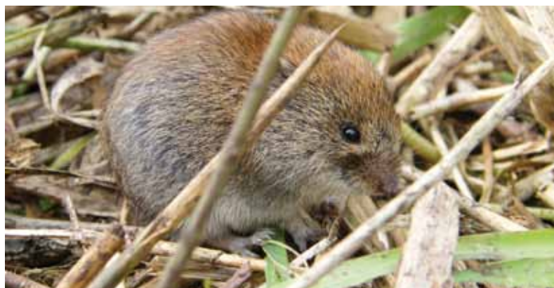
Ik noemde hem 'Piep'

Wie kent ze niet? Tegen het vallen van de avond komen de knagdieren uit hun hol gekropen en in dit geval maakt het niets uit of je aan de gracht of ergens aan het Amsterdam-Rijnkanaal zit te vissen. Muizen en ratten zitten werkelijk overal. De grap van deze springerige diertjes is dat ze in een paar uur tijd redelijk tam zijn te maken. Een stukkie brood of worst is voldoende. Gewoon een