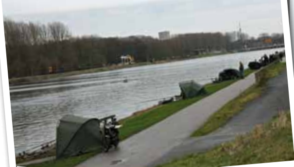
De 'baan' ligt er weer mooi bij...