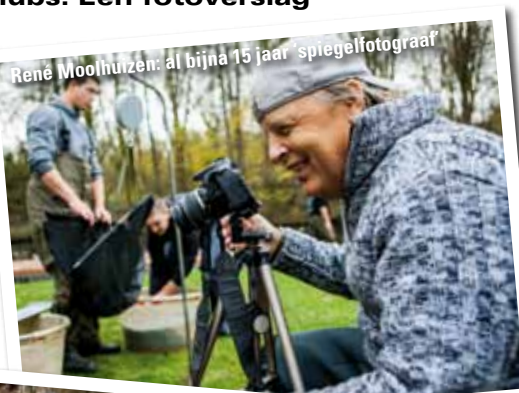
Samen die mooie proberen te scheppen