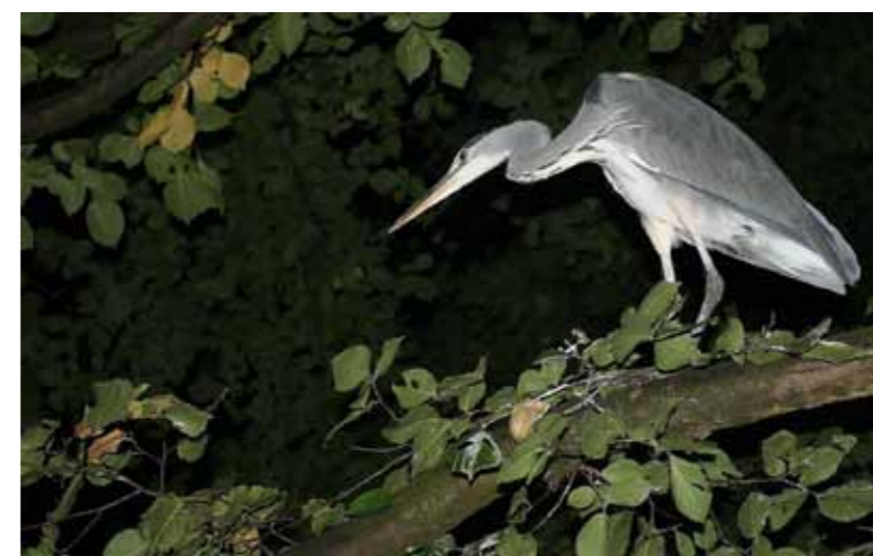
Denk als een vis, vis als een reiger!

Aangekomen bij ieder willekeurig water van de AHV, observeer ik als eerste de andere vissers, de windrichting en de zonkant. Ook speur ik naar obstakels, watervogels en natuurlijk naar vis-activiteit. Soms ben ik na een lange dag lopen en speuren er nog niet uit, dan voer ik verschillende interessante plekken aan om ze daarna af te vissen. Vaak is dan een uurtje hengelen al genoeg om de vis te vinden. Als ze niet in jouw zone zwemmen, vang