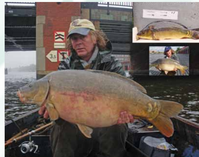
Herfst 2009: wat gaat dat worden? (3 + 4)

In maart 2011 werd ik gebeld door beroepsvisser Van Wijk. Hij was aan het vissen op De Die-men en had twee mooie spiegels gevangen, of ik ze misschien wilde komen fotograferen. Ik liet alles vallen waar ik mee bezig