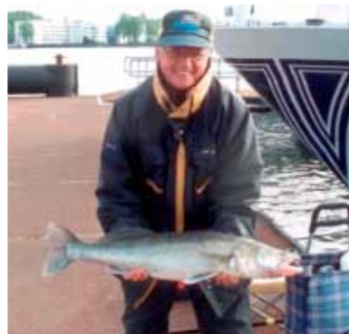
Op het IJ bukt het ook van de rovers!

In 1988 kwam de gevlochten lijn in opkomst, dat zou het helemaal moeten zijn. Puzzelend met hoofdlijn, gevlochten lijn en andere haken was ik er eindelijk uit. In