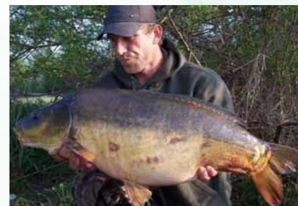
De weg kwijt? Terugmelding van het Gooimeer! (6)

Wat zou het doen met een karp om gevangen te worden in een zegen op de Tweede Diem en uitgezet te worden op de Derde aan de andere kant van het kanaal? Dat het Amsterdam-Rijnkanaal, met z'n stalen damwanden, onvriendelijk is voor zoogdieren die naar de overkant willen is bekend en logisch, maar ook karpers, weten we dankzij ons SKP, steken niet allemaal zomaar over. Zou ons 'futuretarget' de weg wel terugvinden? Het antwoord kwam sneller dan ik had verwacht.