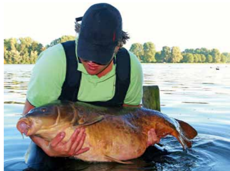
Mokums schilderij, goede herinnering.