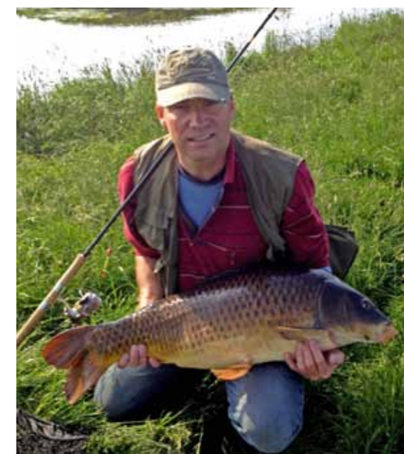
30 pond, 30 cm uit de kant. Flex!

Deze prachtige twintiger rook geen 'Lont'.