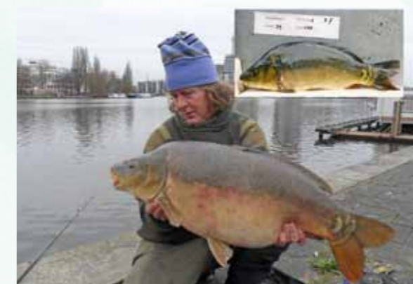
December 2011: 'De Verstekeling' terug bij af. (7)

meer. Het duurde weer even voor ik doorhad dat het 'De Verstekeling' was, afgepaaid en wel! Hoe was-ie daar terecht gekomen? Niet door het spuisluisje bij Smeenk, want dat staat slechts een enkele keer bij extreem hoog water open. Dan moest-ie haast wel door de Oranjesluizen (route 1) zijn gegaan of door de sluis in Muiden (route 2). Projectspiegels die na jaren terugkeren naar een plek uit een eerdere periode van hun leven, zijn geen zeldzaamheid, maar 'De Verstekeling' achtte ik voorlopig verloren voor de Amstel en daarmee ook voor mijn haak en dat vond ik best jammer.