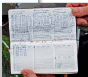
De eerste 50 meter van 2013 is alweer gevangen!

Van jongs af aan ben ik al fanatiek met vissen bezig. Toen ik eenmaal in Amsterdam kwam werken als banketbakker ging ik al gauw in de Amsterdamse grachten vissen. Tussen de middag had ik 1 ½ uur pauze en ging dan lekker vissen. Een beetje paneermeel als voer, een slap deegje en bijna altijd vis, voornamelijk blankvoorn maar ook brasem en af en toe een karp. Na mijn diensttijd kwam ik weer terug bij de banketbakker en natuurlijk weer vissen tussen de middag. Ik reed inmiddels auto en al gauw had ik het plan om 's morgens vroeg voor mijn werk ook te gaan vissen in de gracht bij het oude stadhuis. Ook dat vond ik helemaal top! Maar om te stoppen als je moest gaan werken, dat was wel wat minder leuk.