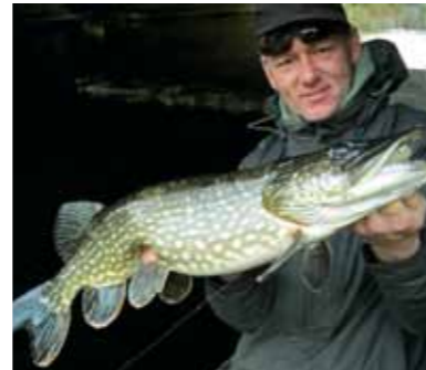
Lekker vadsig, onder een brug vandaan 'geplukt'

polariserende bril, eentje met van die gele glazen voldoet perfect bij donker weer. Het water wordt met het jaar meer helder en het is soms bijna eng wat je kan zien als je zo'n ding op je neus hebt. Zelfs als ik niet ga vissen heb ik er eentje bij me. Zie ik onverhoopt wat, dan sta ik een paar dagen later te vissen op die plek.