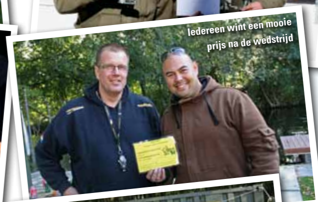
Iedereen wint een mooie prijs na de wedstrijd