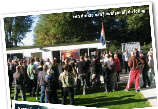
Een drukte van jewelste bij de loting