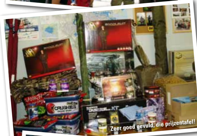
Zeer goed gevuld, die prijzetafel!