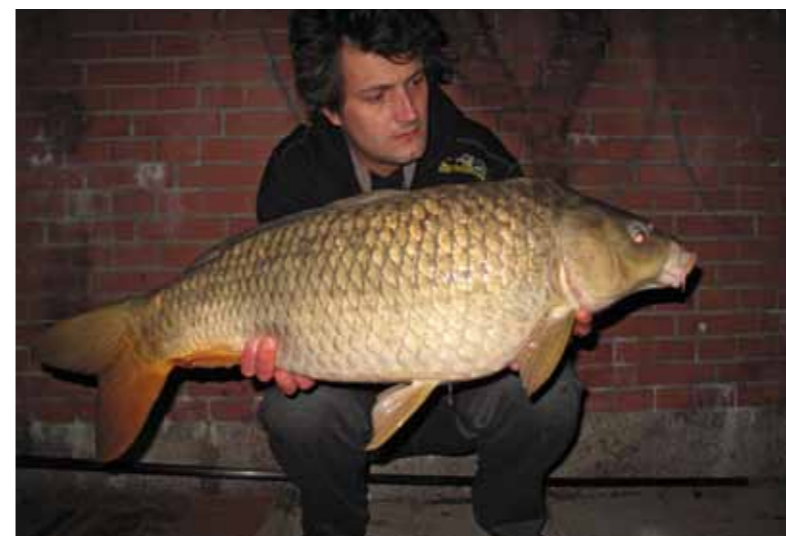
Echt een mooie schub

Het eerste uur gebeurt er niets. Dan ineens een oploper bij de woonbootstek, die stopt... Brasem of een lijnzwemmer? Ik twijfel niet aan mijn montage. Door met verschillende onderlijnlengtes op deze stek te vissen ben ik erachter gekomen dat ongeveer 14 cm de gewenste lengte is. Doordat de haken soms uitbogen van de snoeiharde runs, gebruik ik nu al een tijdje superstrongs maat 6 van Piet Vogel en 'zachte' safetyclips. Met dit systeem komt het lood snel los en zit de haak als een huis en buigt niet uit. Als de hengel nog geen half uur op de steunen ligt begint de slip te lopen. Bij het oppakken van de hengel buigt de blank flink door. De vis weet van geen ophouden en zwemt gestaag van mij af. Uiteindelijk, na een paar keer in de lelies vast te hebben gezeten, kan ik hem scheppen. Koning! Dit is echt een mooie schub! Na wat foto's werp ik de rig weer op zijn plaats. Dan stuur ik wat appjes naar vrienden en vismatten en terwijl ik de foto's bekijk neem ik hun felicitaties in ontvangst. Om 22.30 uur weer een run op dezelfde hengel. Bij het contact maken voel ik onaangename weerstand, de lijn loopt vanaf mijn top direct het water in en blijft ergens achter haken. Dit heb ik hier nog nooit meegemaakt. Helaas schiet de vis los terwijl ik 'm al aan de opper-