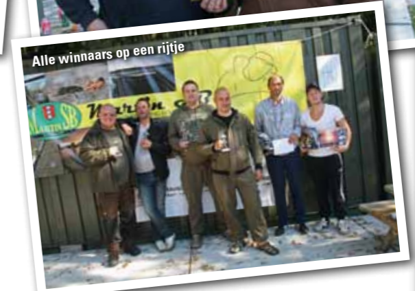
Alle winnaars op een rijtje

De volgende Sloterplas karperekoppelwedstrijd zal plaatsvinden op 18, 19 en 20 april 2014. Voor meer informatie: 06-55 85 49 06