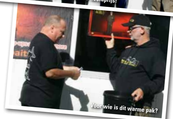
Voor wie is dit warme pak?