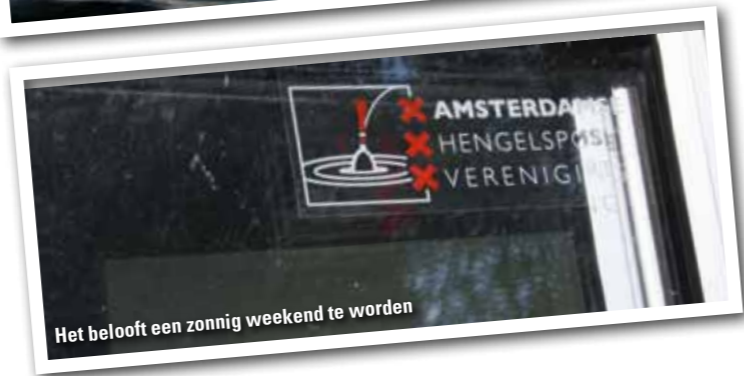
Het belooft een zonnig weekend te worden