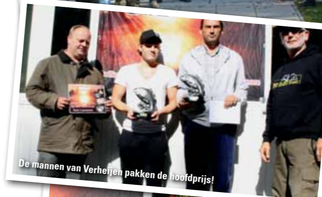
De mannen van Verheijen pakken de hoofdprijs!