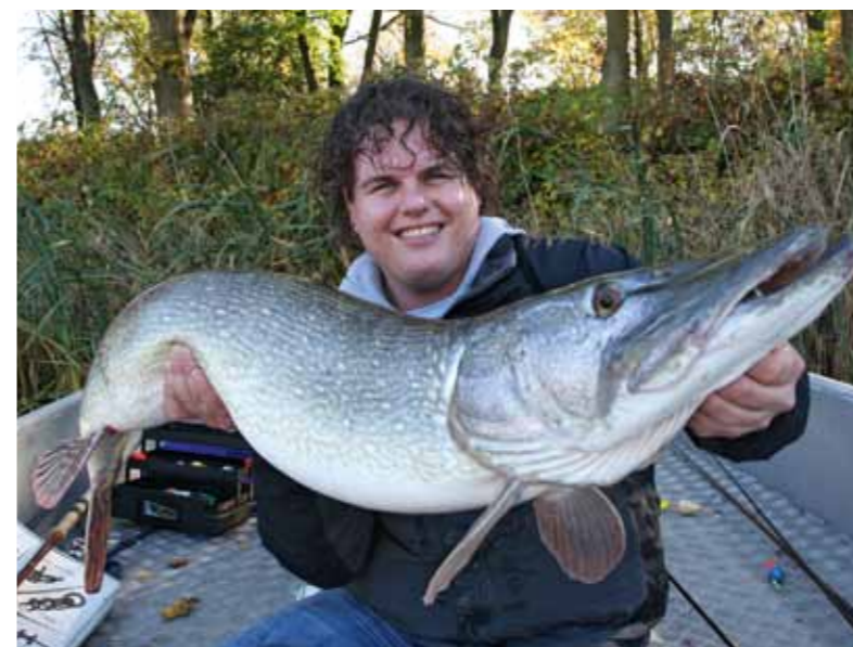
Het lijkt wel een krokodil!

links vlak voor een treurwilg. Mijn dobbers hetzelfde, één tegen een woonboot aan de overzijde en de ander rechts een metertje uit de kant.