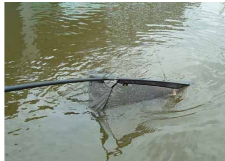
Ik steek het net in het water en schep de vis.

Hengel nummer één leg ik een stuk naast een brug waar ik in het verleden ook al heb gevangen. De andere hengel leg ik helemaal aan de andere kant in een hoekje vlak voor een duiker. Ik voer per stek een paar handen verkrumelde boilies. Op de hairs heb ik een klein stukje boilie gezet