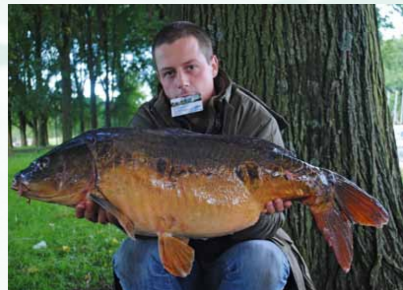
Een oudje van de Sloterplas.