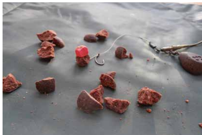
Verkrumelde boilies werken top in de herfst!

omdat ik volgende week tentamens heb. Ik besluit de boeken met lesstof mee te nemen naar de waterkant om tijdens het vissen te kunnen studeren. Vanwege de plotselinge stijging van de temperatuur ga ik op een klein en ondiep watertje bij mij in de buurt vissen. Het water ligt in een nieuwbouwwijk in Amsterdam-West, midden tussen de huizen. Hier zal de plotselinge warmte de meeste invloed hebben. Er zitten