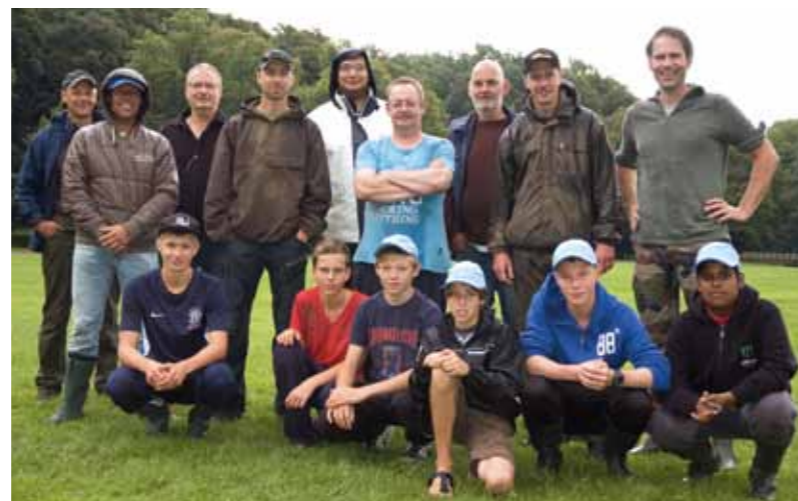
Een geslaagd weekend met een gezellige groep.

waren gegooid om een kanoroute uit te zetten. En die boeien lagen behoorlijk in de weg. Sommige hotspots van de vorige keer bleken daardoor onbevisbaar. Er werd streng op toegezien dat er niet te dicht bij de boeien werd gevist. Visveiligheid stond natuurlijk voorop.