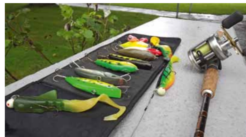
Groot kunstaas en een stevige pook!

Dat is dan ook de reden dat ik veelal kies voor felle kleuren. Doorgaans vis ik de 15 à 22 cm lange shads op lichte loodkoppen met een grote haak. De shad heeft van zichzelf al een behoorlijk gewicht en loopt prachtig mooi door het water in combinatie met een kleine ronde jigkop. Omdat de shad vrij groot is plaats ik er meestal een extra dreg bij. Een andere goede oplossing is het gebruik maken van een 'kurkentrekkerkop' (een loodkop die je in