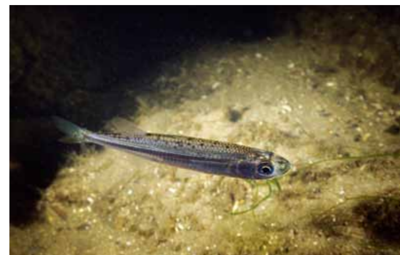
De Kleine Koornaarvis, Amsterdams nieuwste aanwinst, zie ook kadertekst.

in welke mate de diverse vissoorten de vispassage bereiken en ook daadwerkelijk gebruiken.