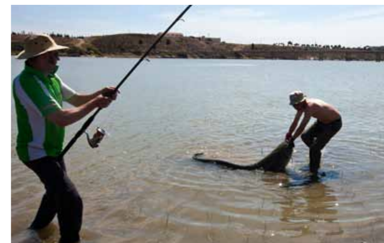
Lebbis grijpt de kolos in de onderkaak; de strijd is beslecht.