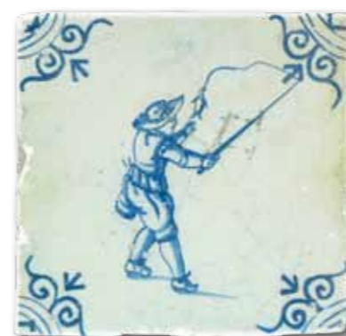
18 e eeuwse tegel met hengelaar.

Tijdens het visseizoen werd er bij weer en wind wekelijks of tweewekelijks gevestigd. Bijna altijd op zondag, omdat zaterdag toen voor iedereen nog een werkdag was. Er werd om half zeven 's ochtends verzameld in het cafe, daar werd koffie (of iets anders!) gedronken en de loting gedaan wie op welke plek mocht beginnen. Elke visser kreeg namelijk een eigen stukje van vijf meter waterkant toegewezen waar hij mocht vissen. Aan de hand van genummerde paaltjes die om de vijf meter in de grond werden gestoken, werd het parcours door de paaltjeszetter uitgezet. 's Ochtend werden (meestal) vijf periodes van twintig minuten gevestigd, 's middags nog drie of vijf. Na elke periode werd een nieuw stuk afgezet en schoof je ook vijf meter op naar rechts, om alle kansen zo