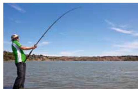
Eindelijk is het dan raak. Een ruim 200 meter lange worsteling is ingezet.

Overgewicht is hier geen zwakte, het lijkt een voorwaarde om te mogen deelnemen. Het feestmaal aan de vooravond van de drie dagen durende wedstrijd is hierop afgestemd. Lompe stukken rund en kip drijven samen met gefrituurde aardappelen en een verdwaaald schijfje wortel in bak vette jus die rechtstreeks uit de afdeling liposuctie lijkt te zijn getrokken. Uit de zaal niets dan complimen-