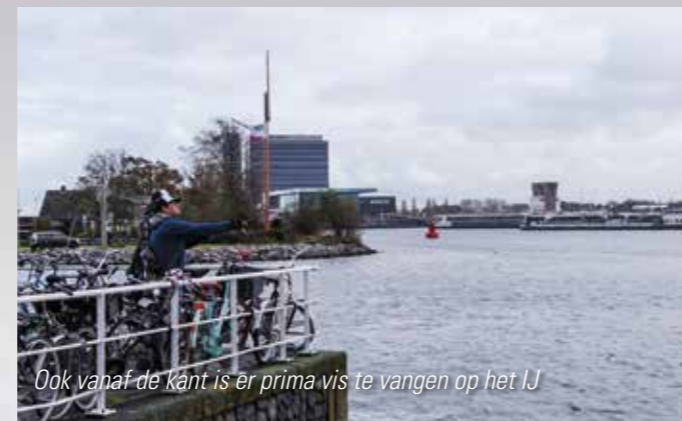
Ook vanaf de kant is er prima vis te vangen op het IJ

Het IJ is ingebracht in de VISpas en dat betekent dat iedereen met een VISpas van een Hengelsportvereniging een hengeltje uit kan gooien in het IJ. De AHV krijgt echter steeds meer signalen dat het tijd wordt om in te gaan grijpen. Als de AHV bijvoorbeeld besluit om het IJ uit de ingebrachte wateren van de VISpas te halen krijgt ze meer grip op de situatie. Je kunt dan bijvoorbeeld sportvissers die de regels overtreden de VISpas van de AHV ontnemen en dan kunnen zij in elk geval niet meer aan de slag op het IJ. Dat je je als vereniging niet populair maakt als je viswater uit de VISpas terugtrekt is duidelijk. Veel leden van andere HSV's voelen zich dan gedwongen om lid te worden van de AHV. Voor alle duidelijkheid zetten wij hiernaast de voorschriften t.a.v. het vissen op het IJ nog maar eens op een rij: