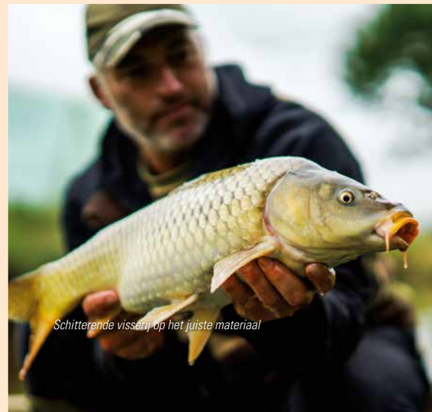
Schitterende visserij op het juiste materiaal

In zomaar een paar uurtjes struinen kun je zoveel beleven en dat is volgens mij wat sommige karpers missen, de belevenis. Een vis van dertig kilo lijkt soms wel de nieuwe maatstaf en de weg er naar toe is minder belangrijk. Geven vangsten zonder foto minder beleving? Geen foto geen bewijs, maar wat is de definitie van bewijs? Zeg het maar. Ik vis voor mijn plezier en probeer via mijn eigen beleving het bewijs te leveren dat het niet alleen maar om het gewicht gaat. Mijn motto is dan ook; vergeet vooral niet te genieten en beleef de weg naar je succes intenser! ✘