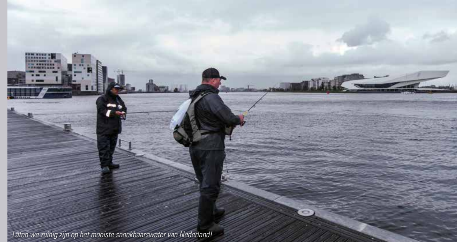
Laten we zuinig zijn op het mooiste snoekbaarswater van Nederland!