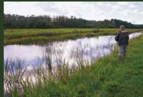
De mogelijkheden zijn eindeloos

ligt te wachten, scholen ruisvoorn in een heldere zijslot en de grote voorjaarscholen brasem... Voor de vliegvisser is het puur genieten in onze polders!