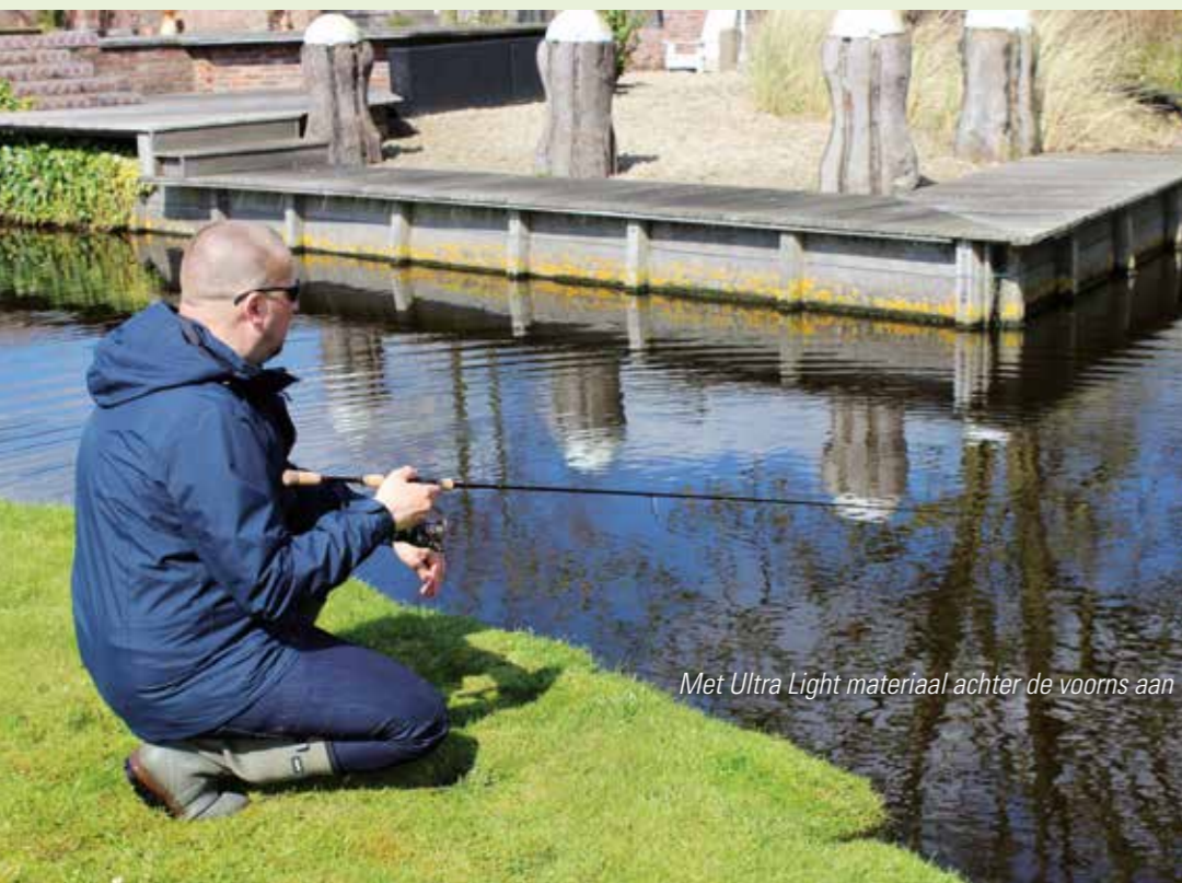
Met Ultra Light materiaal achter de voorns aan

zullen zij het gedrag van vissen gaan herkennen. Trek er dus gezamenlijk op uit dit voorjaar en vergeet vooral niet te genieten! Oh ja, vergeet je AHV VISpas niet! ✘