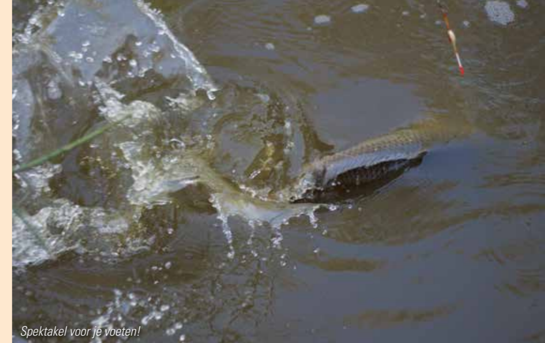
Spektakel voor je voeten!

De vis nadert opzichtig mijn haakaasje bestaande uit twee fijngeknepen maïskorrels op een haakje 10. Tot twee maal toe trekt de vis mijn pennetje met z'n logge lijf onder, m'n draad blijft hangen achter een vin en schiet weer los zodat het pennetje weer in positie staat. Het is een zekerheidje dat de hengel straks een zwiep krijgt om de haak te zetten. Het rode tipje van de pen klimt uit het water, het teken dat de vis het aas in z'n bek heeft genomen. Vervolgens de zwiep, de haak is gezet en de sloot wordt tot schuim geslagen, love it, spektakel voor mijn voeten!