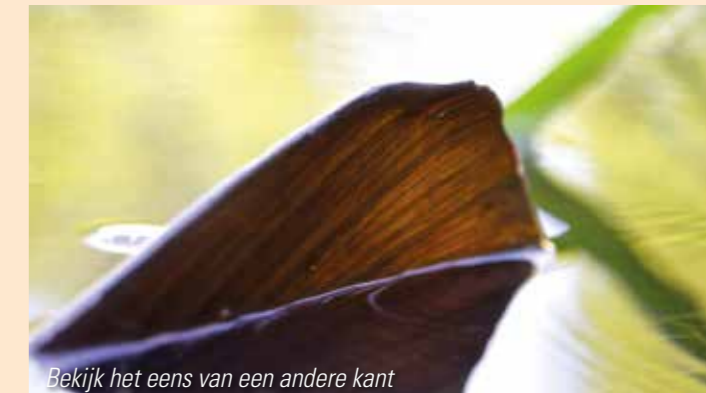
Bekijk het eens van een andere kant

Twee karpers op een dag is maar magertjes, vijf of zes vissen is eerder de standaard. Tien vissen is een goede dag, maar op de echte topdagen vang je er zomaar 15 tot 30! Het zijn geen zware biggen of dikke bakken maar dit is voor mij de manier om karper te vangen.