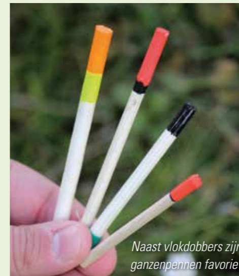
Naast vlokdoobers zijn ganzenpennen favoriet

Ook al heet het vlokvissen en heb je hiervoor speciale vlokdoobers, zegt dat uiteraard niet dat je alleen deze kunt gebruiken. Veel vlokdoobers hebben in combinatie met dun nylon de neiging bij de loodjes in elkaar te gaan draaien tijdens het werpen of door een paar keer mis te hebben geslagen. Nu zullen er allerlei foefjes zijn om dit probleem te verhelpen, maar de aloude ganzenpen die men slechts aan de onderzijde bevestigd met een rubberetje blijft toch wel een simpele, maar zeer doeltreffende oplossing.