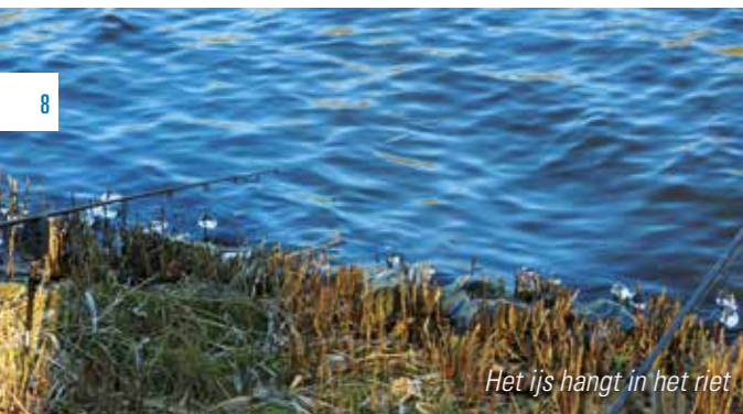
Het ijs hangt in het riet

Zondag 25 februari organiseerde de Roofviscommissie van de AHV voor de eerste keer een doodaas wedstrijd op de Bosbaan. De omstandigheden waren niet bepaald aantrekkelijk, het had de hele week al gevoren maar de Bosbaan bleef gelukkig ijsvrij door een stevige oostenwind. 23 vissers hadden zich opgegeven om de uitdaging aan te gaan een snoek, snoekbaars en/of baars op de kant te krijgen. Tijdens het verzamelen 's morgens bleek dat twee deelnemers zich afgemeld hadden en één was door de griep geveld. Hierdoor gingen 20 vissers met elkaar de strijd aan.