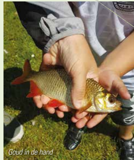
Goud in de hand

Laten deze hengeltjes ook nog eens uitermate geschikt zijn voor het vlokvissen! Nu heb ik zelf een dergelijk zeven grammertje staan, met een lengte van 1.90 meter, wat prima volstaat voor het vlokvissen. Zet hier een licht 500-1000 model werpmlentje met goede slip op en spoel deze op met nylon, 16/00 tot 18/00. Eerlijk gezegd zou je nog beter met 14/00 aan de slag kunnen gaan, maar het zal niet de eerste keer zijn dat een karpers besluit mijn voor de voorn bedoelde vlok te pakken. Met een iets zwaardere lijn kun je gewoon net even wat beter de vis onder controle houden en heb je de kans een karpertje te