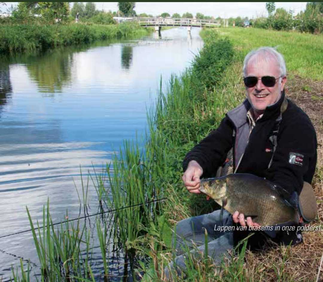
Lappen van brasems in onze polders!

Wordt vervolgd in het volgende AHV VISSSEN magazine. ✕