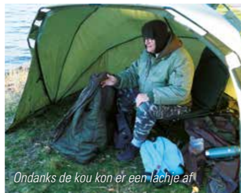
Ondanks de kou kon er een lachje af

De wedstrijd begon met een flauwe windkracht 2 welke al snel aanwakkerde tot een ijskoude windkracht 6 met een gevoelstemperatuur van -7. Enkele diehards trotseerden zonder extra bescherming de wind en de ijzige kou maar de meeste hadden zich goed aangekleed. Sommige hadden zich zelfs met bivvy en kachel langs de Bosbaan geïnstalleerd, geef ze eens ongelijk!