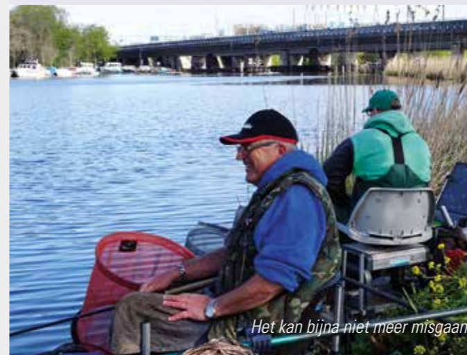
Het kan bijna niet meer misgaan

Als lid van de AHV zit je goed met al die prachtige viswateren in en rond Amsterdam. Binnen een straal van een kilometer of twintig heb je de viswateren voor het uitkiezen. Eén van die locaties waar je in het voorjaar prima terecht kunt om een dagje te gaan vissen is de Amstel.