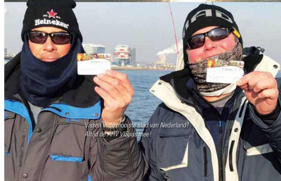
Vissen in de mooiste stad van Nederland? Altijd de AHV VISpas mee!