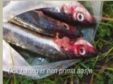
Ook haring is een prima aasje