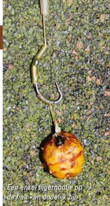
Een enkel tijgernootje op de haak kan dodelijk zijn