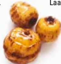
Knapperig en gezwollen

Op internet vind je veel recepten; het allerbelangrijkste, naast eventuele toevoegingen, is dat je de noten lang weekt (24 uur minimaal) en daarna een klein uurtje kookt. Doe je dit niet, dan zijn de noten niet geschikt voor gebruik. Een tijgernoot die goed is, is knapperig en helemaal gezwollen.