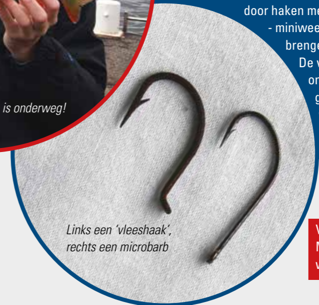
Links een 'vleeshaak', rechts een microbarb

De eerdergenoemde tegenstanders vinden het onzin om iets te veranderen aan de alom bekende weerhaak. Die werkt immers al 100 jaar, niks veranderen dus. De voorstanders pleiten juist om de weerhaak plat te knippen of helemaal weg te laten. De commercie is hier handig op ingesprongen door haken met zogenaamde microbarbs - miniweerhaakjes - op de markt te brengen. Het beste van 2 werelden! De vis blijft vastzitten en het onthaken geschiedt zonder gewrik en gedoe. Grote weerhaken? Not hot!