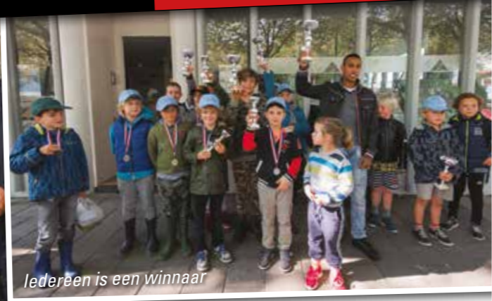
Iedereen is een winnaar