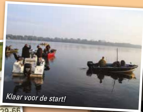
Klaar voor de start!

Het eindresultaat was dat er in totaal maar liefst 55 snoekbaarsen, een aantal snoeken en baarsen zijn gevangen. Kortom een topdag met fantastisch mooi weer! ✕