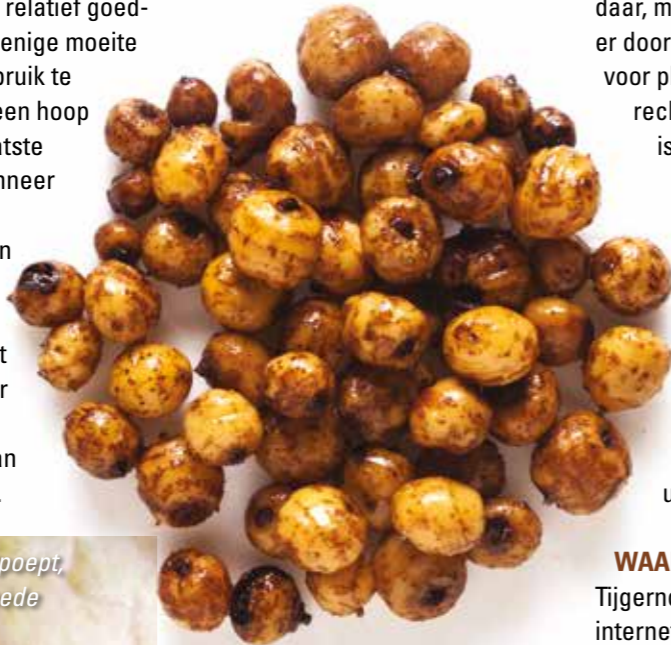
Als een karper dit uitpoept, dan weet je dat je goede noten gebruikt!