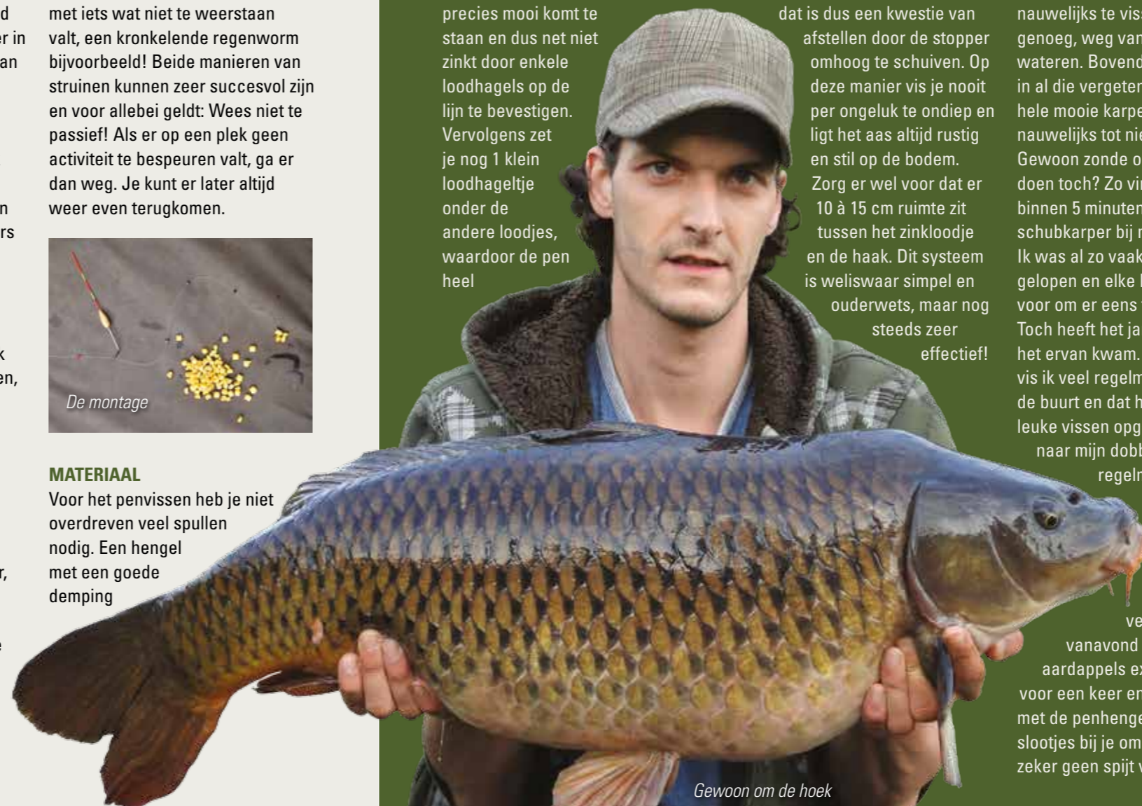
Gewoon om de hoek

In Amsterdam wemelt het van de interessante penstekken. Vaak zijn dit plekken waar met de elektronische pieper niet of nauwelijks te vissen valt. Er is plek genoeg, weg van alle drukbeviste wateren. Bovendien huizen er in al die vergeten wateren vaak hele mooie karpers. Vissen die nauwelijks tot niet bevestigd worden. Gewoon zonde om niks mee te doen toch? Zo ving ik vorig jaar binnen 5 minuten een waanzinnige schubkarper bij mij om de hoek. Ik was al zo vaak langs dat plekje gelopen en elke keer nam ik mezelf voor om er eens te gaan pennen. Toch heeft het jaren geduurd voor het ervan kwam. Na die vangst vis ik veel regelmatig bij mij in de buurt en dat heeft al heel wat leuke vissen opgeleverd. Turend naar mijn dobber voel ik me nog regelmatig dat kleine kereltje dat ooit zo begon met karpereen. Pennen gaat nooit vervelen. Dus kook vanavond gewoon een paar aardappels extra, laat die tv uit voor een keer en ga eens vissen met de penhengel in een van die slootjes bij je om de hoek! Je zal er zeker geen spijt van krijgen! ✕