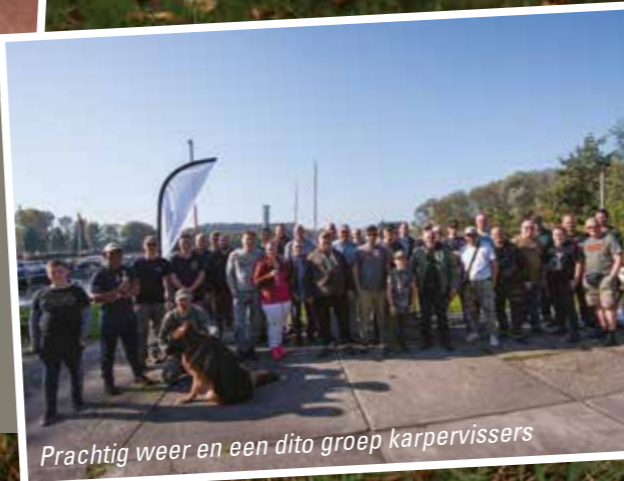
Prachtig weer en een dito groep karpervissers