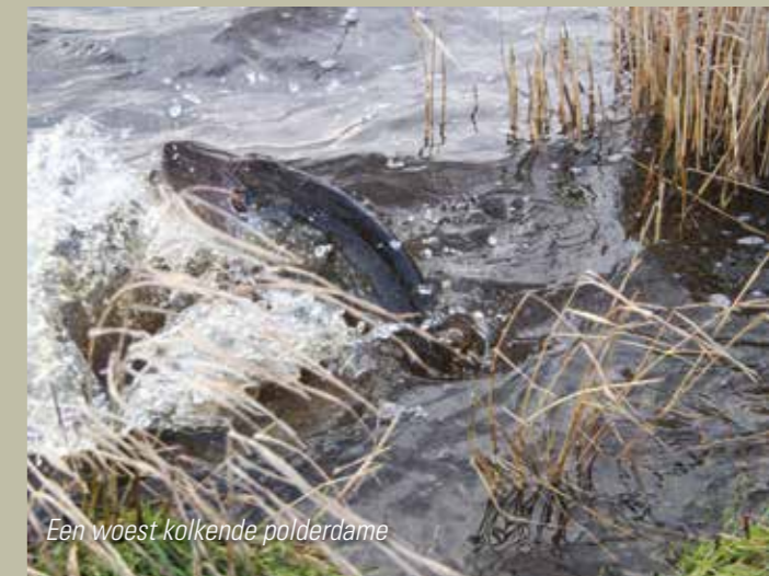
Een woest kolkende polderdame

De takels werden voorzien van een verse voorn, die inmiddels al aardig ontdood was, en langzaam driftend onder de brug doorgeleid. Bij de derde drift was het raak. Geen rimpeltje op het water, geen kolk, niets, alleen de kleine kringeltjes van de snoekdrijver. In het donkerbruine water zie ik de drijver langs de kade van de brug op nog geen 10 cm van het wateroppervlak voorbijkomen. De 'slangachtige' beweging van de drijver verradt dat er een grote vis zich vergist heeft in de forse voorn. Voordat deze zich verslikt, tik ik stevig aan en een monsterlijke kolk wordt geslagen in het donkerbruine water.