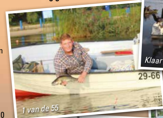
1 van de 55