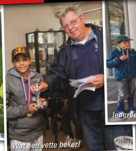
Wat een vette beker!