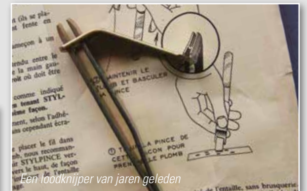
Een loodknijper van jaren geleden

De loodknijper is een apparaatje dat ook al geruime tijd bestaat. Het heeft eigenlijk nog het meeste weg van een grote nagelknipper. Het voordeel van een loodknijper is dat je de hagel- en/of stijloodjes perfect op je lijn kan klemmen zonder dat deze beschadigt. 'Een echte visser gebruikt zijn tanden', hoor ik ik je denken. Inderdaad, dat kan ook, maar met de kennis van nu over de schadelijkheid van lood is zo'n eenvoudig knijpertje toch wel aan te bevelen.