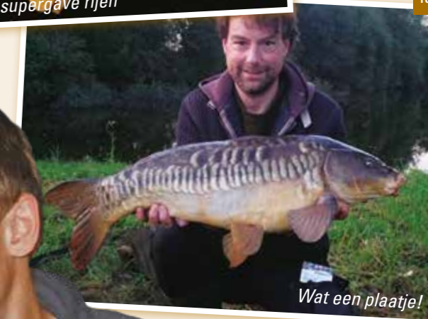
Wat een plaatje!