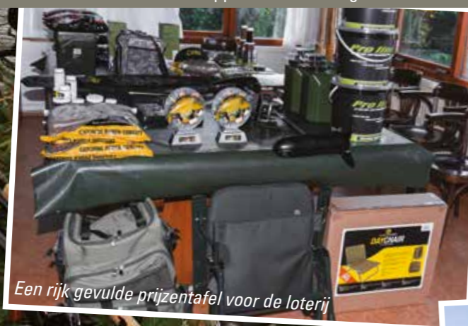
Een rijk gevulde prijzetafel voor de loterij

De winnaars: 1 e Plaats: Het koppel Ron van Poelgeest en Erwin Kool met twee schubkarpers van 8 en 12 kg.