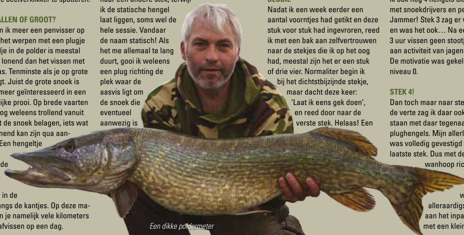
Een dikke poldermeter