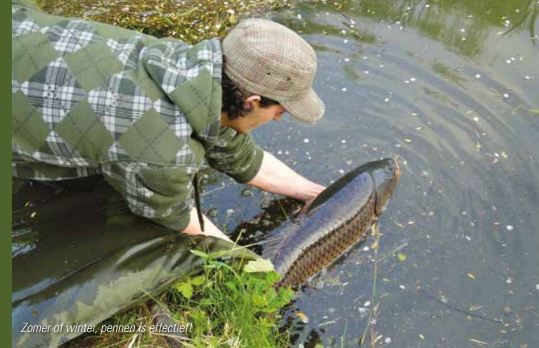
Zomer of winter, pennen is effectief!

Op de hoofdlijn schuif ik eerst een silicone stopper, dan een schuivende pen, dan het lood en onderaan uiteraard de haak. De truc zit hem in de manier van uitloden; zorg dat de dobber precies mooi komt te staan en dus net niet zinkt door enkele loodhagels op de lijn te bevestigen. Vervolgens zet je nog 1 klein loodhageltje onder de andere loodjes, waardoor de pen heel