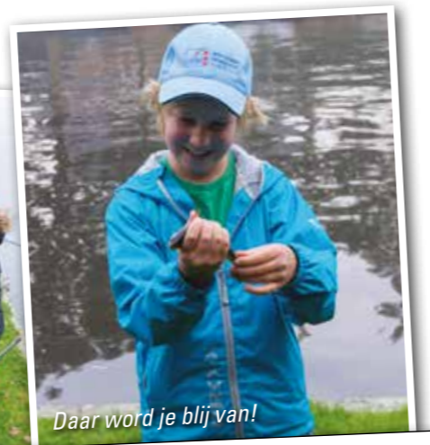
Daar word je blij van!