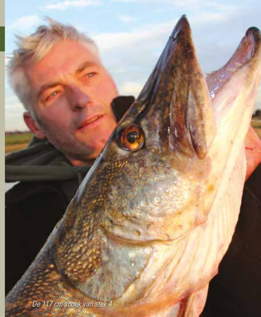
De 117 cm snoek van stek 4

te triggeren. Af en toe kan ik op die manier nog een aanbeet forceren. Toeval of niet? Vertrouwen is het sleutelwoord.