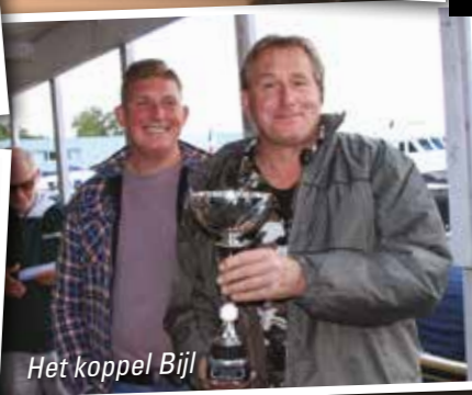
Het koppel Bijl