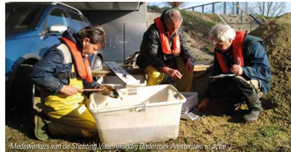
Medewerkers van de Stichting Visserijkundig Onderzoek Amsterdam in actie

De Amsterdamse Hengelsport Vereniging doet aan visserijkundig onderzoek. Hierbij maken wij gebruik van de diensten van de Stichting Visserijkundig Onderzoek Amsterdam.