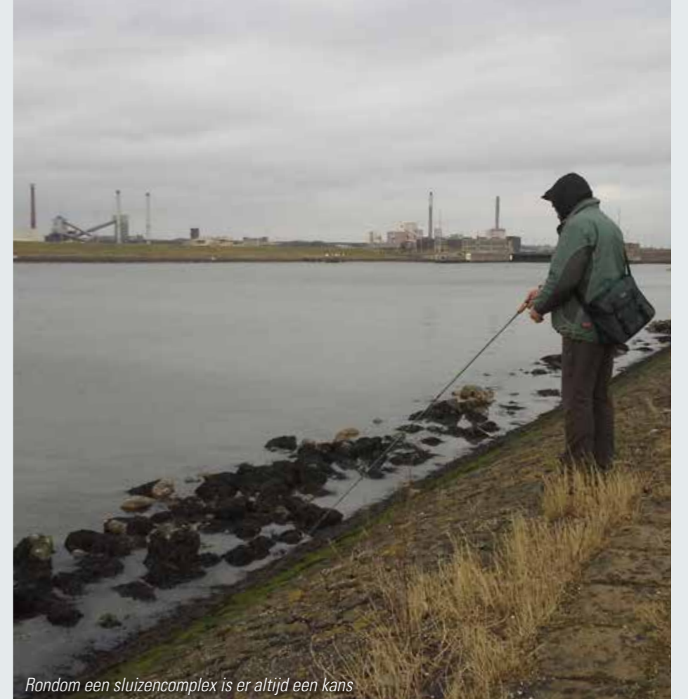
Rondom een sluizencomplex is er altijd een kans

een gehaakte zeeforel absoluut nog geen gevangen forel. Een snelle 3000-4000 model werpmolen heb je nodig om zowel langzaam als snel te kunnen draaien, licht kunstaas weg te kunnen krijgen en obstakels te vermijden. Een 10/00 gevlochten lijntje en een 1,5 meter lange fluorocarbon onderlijn van ca. 28/00 volstaat. Verder heb je slechts een handje vol kunstaas nodig zoals lepeltjes, kleine plugjes en verzwaarde spinners. Ook doe je er goed aan om de haken te verlengen met een dubbele splitring om wat meer ruimte te creëren. Een enkele haak zoals de diverse single hooks van Gamakatsu is misschien nog wel de beste optie, want een goed gehaakte enkele haak blijft naar mijn mening beter zitten tijdens de dril dan één klein haakpuntje van een dreg. Verder adviseer ik je altijd een schepnet mee te nemen. Zeeforellen, vooral de kleinere exemplaren, hebben de neiging te gaan krokodillendraaien voor de kant. Hoe langer je wacht, des te groter is de kans dat deze zich weet te ontdoen van de haak. Het meeste succes heb ik persoonlijk altijd vroeg in de ochtend en tijdens schemer. Daarnaast adviseer ik je vooral gevarieerd te vissen, want bij constant binnen vissen heb je meer kans op volgers. Door geregeld een spinstop te maken, te versnellen of door van draairichting te veranderen creëer je meer potentiële momenten dat de zeeforel kan toeslaan.