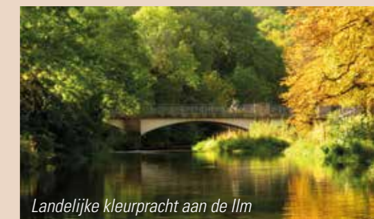
Landelijke kleurpracht aan de Ilm

Het forelseizoen mag dan in het buitenland gesloten zijn, voor de vlagzalm kun je vaak nog terecht op stromend water. En laat nu de (late) herfst het seizoen zijn voor de lady of the stream. Ze zijn in deze periode vaak gretiger dan in de warme zomermaanden. Houd wel rekening met de keuze van je vlieg: zowel de nimfen als de droge vliegen vallen beduidend kleiner uit dan in de warme maanden. Wie een beetje handig Googelt vindt al snel trajecten waar je aan de slag kunt. De Duitse Aar is daar een mooi voorbeeld van. Een traject van 16 kilometer, prachtig gelegen in een dal in het Sauerland. Meer info vind je op www.fischzucht-wagner.de