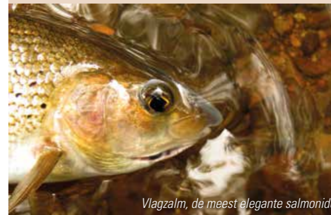
Vlagzalm, de meest elegante salmonide

Rond 15 oktober sluit in onze buurlanden het forelseizoen. Voor veel vliegvissers is dat het moment om de vliegvisspulletjes op te bergen en terug te blikken op een welgeslaagd seizoen. Wat echter vergeten wordt is dat er nog een prachtige periode in het verschiet ligt. De late herfst- en vroege wintermaanden bieden de vliegvisser namelijk ongekende mogelijkheden.