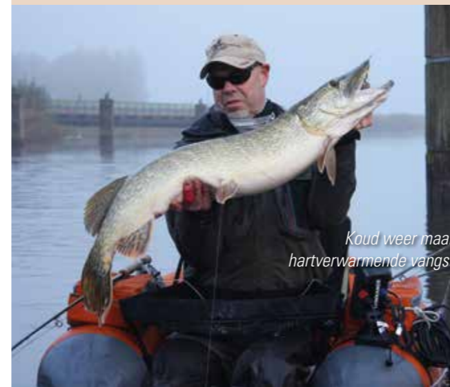
Koud weer maar hartverwarmende vangst

lets verder weg, in de Duitse deelstaat Thüringen ligt een aantal rivieren waar je ook in de wintermaanden (tot 1 februari) terecht kunt voor het vissen op vlagzalm. Een van die riviertjes is de Ilm. Kijk maar eens op www.angelfreunde-stadtilm.de . Wel even opletten: voor het vissen in Duitsland heb je wel een Jahres Angelschein nodig. Die zijn aan te vragen bij ieder stads- of gemeentehuis van een grotere Duitse stad. ✕