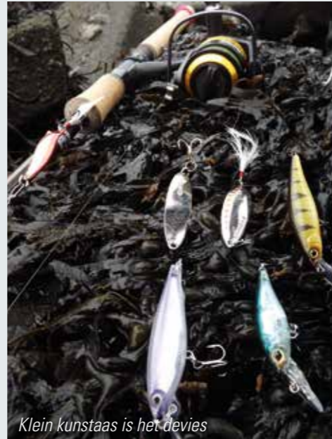
Klein kunstaas is het devies

soms draaien aan het wateroppervlak of gewoon keihard jagen. In de zomer kan men ze aan de kust geregeld zien springen en zijn ze juist erg passief en trekken ze meer naar open zee waar het water koeler is. Ondanks zijn naam houdt een zeeforel zich gedurende koude periode juist graag op in brak water. De huid van de zeeforel is niet goed bestand tegen koud zout water en dus is een water als bijvoorbeeld het Noordzeekanaal uitermate geschikt om te overwinteren.