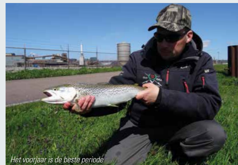
Het voorjaar is de beste periode

Ondanks het feit dat de zeeforel (en zalm) van nature in Nederland voortkwam, is er toch een periode geweest waarin het niet zo goed ging met deze prachtige trekvissen. Vervuiling van water, overbevissing en trekroutes onmogelijk maken zijn daar de belangrijkste redenen voor. Toch zijn wij in Nederland weer begonnen met de rivieren en beken te herstellen naar vanouds en worden barrières aangepast zodat trekvissen weer kunnen trekken. Een mooi voorbeeld is het kierbesluit en zeeforelproject waarbij enkele duizenden zeeforellen zijn uitgezet. Met een beetje goede wil lijkt een traditionele vissoort weer de vis van de toekomst te kunnen worden.