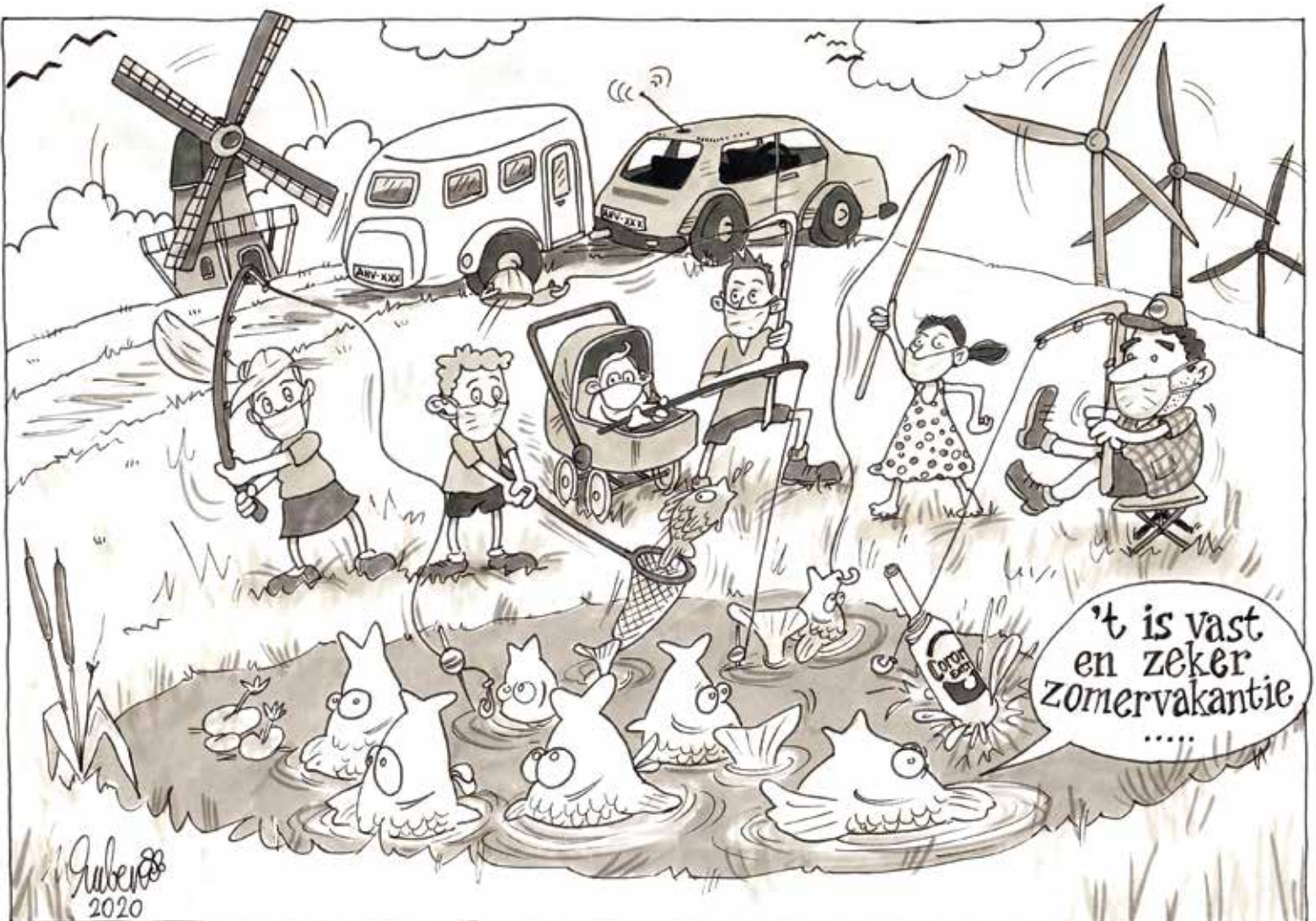
CARTOON: RUBEN VAN AËFST

Lieve leden van de AHV, geniet, beleef en blijf gezond.