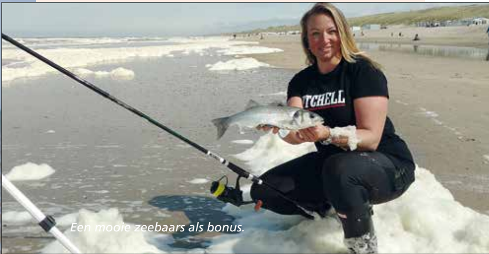
Een mooie zeebaars als bonus.

Gister stond ik nog op het strand, ik was er vroeg, rond 07:00 uur. Bij de strandopgang zag ik dat er 200 meter links een interessante plek was, een grote mui. Snel (voor zover dat mogelijk is met die hutkoffer op m'n rug en zware hengeltas) naar de waterlijn! Ik had er een goed gevoel over, windje, branding, oh, het was zo gunstig... Ik trok mijn waadpak aan, want dan kon ik nog naar een bankje waden en daar m'n steun neerzetten, goed verhaal.