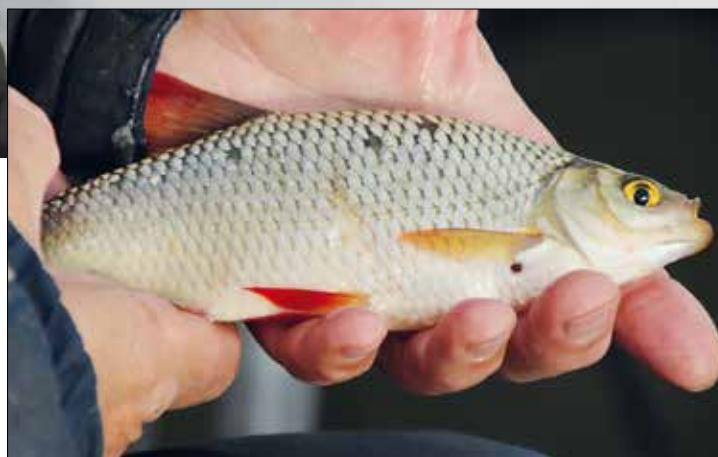
Wintertijd: mooie, stevige voorns.

'S Winters ga ik er vaak op uit met zo weinig mogelijk materiaal. Geen gesleep met grote viskisten, emmers lokvoer en complete packs met veel vaste stokken. Een paar telescopische stokjes van vier en vijf meter is vaak al meer dan genoeg. Die stokjes zijn vaak al voor een Euro of vijftien bij je plaatselijke hengelsportwinkel te koop. Vraag even aan de winkelier of hij er een Stonfo connector op plaatst zodat jij je tuigje er vlotjes aan kunt monteren.