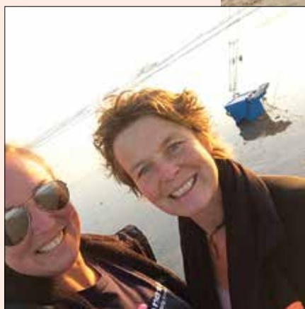
Samen met de dame die nog nooit een vissende vrouw had gezien.

voor hun is het een vreemde gewaarwording. Ik blijf dit toch ZO raar vinden, hoe kunnen mensen het nou nog steeds vreemd vinden dat ik daar sta te vissen? Het is 2019! Hoe kunnen mensen mij, als vissende vrouw, nou vreemd vinden! Het is 2019! Sterker nog, bijna 2020! Daarom ben ik zo blij dat voorbijgangers me durven te benaderen, dan kan ik hun beeld misschien wat normaliseren. De mannen stellen vragen van een ander kaliber. Die vragen zijn veel meer gericht op het glimmende materiaal waar ik mee vis.