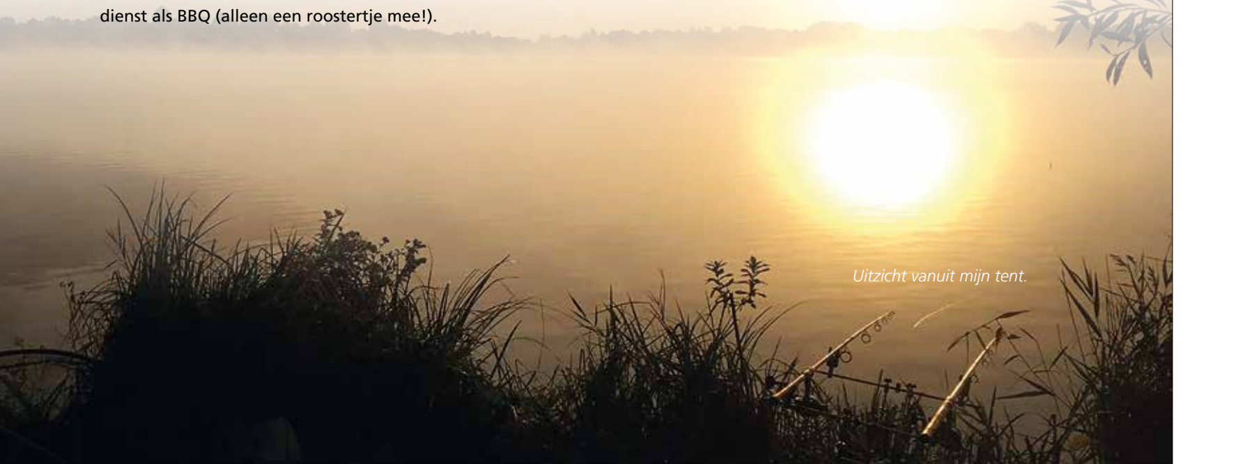
Uitzicht vanuit mijn tent.

Tot slot een laatste tip: plan zoiets niet tijdens feestdagen. Wachttijden voor sluizen e.d. zijn dan langer en andere watergebruikers kun je missen als kiespijn! Veel plezier!