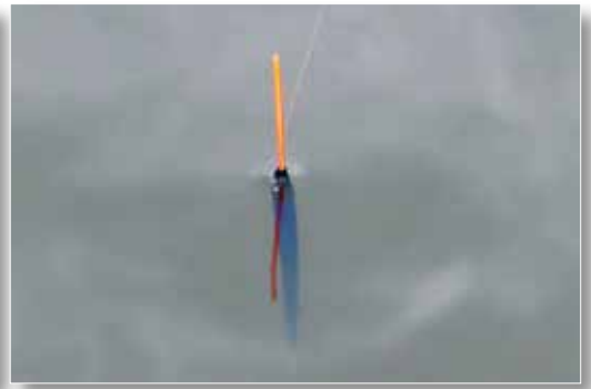
Klein aas, mondjes maat voeren en licht vissen. Basis voor een fijn dagje vissen.

om tussen je vingertoppen vast te kunnen houden. Te veel voeren is niet de bedoeling, de voorn moet je haakaas pakken en zich niet te goed doen aan de casters die je voert.