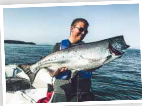
Nick Onze Hengelsport topper!