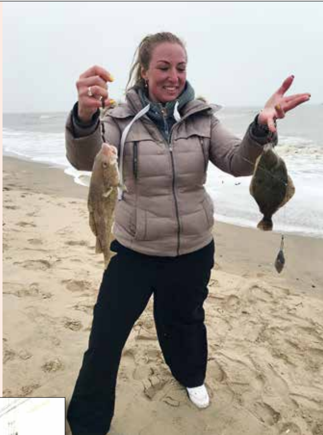
Blij met m'n vangst, ik red me wel.

Ook de mannen-met-hond, of net-klaar-met-hardlopen (respect) komen even bij me kijken. Ze pakken het wel wat voorzichtiger aan dan de dames. Ze komen rustig dichterbij en maken eerst, heel verstandig, even oogcontact om te zien of ik überhaupt wel benaderbaar ben. Boven hun hoofd knipperen grote neonletters "Ik kom in vrede". Ze bekijken mijn uitrusting iets te lang en gluren ongegeneerd in m'n viskoffer. Juist meneer, je ziet bindelastiek en daarnaast lipgloss. Vlakbij de pleisters en de BiFi worstjes. Volkomen logisch. Voor mij. Welkom in mijn wereld. Maar