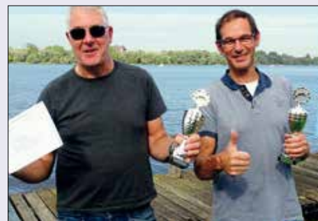
Van boven naar beneden: