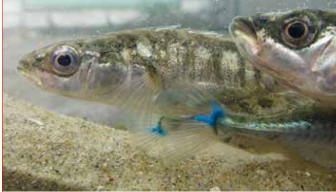
Terugvangst van gemerkte driedoornige stekelbaars