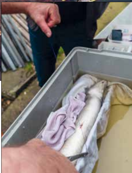
Een schieraal wordt voorzien van een zender.

TEKST MARCO VAN WIERINGEN