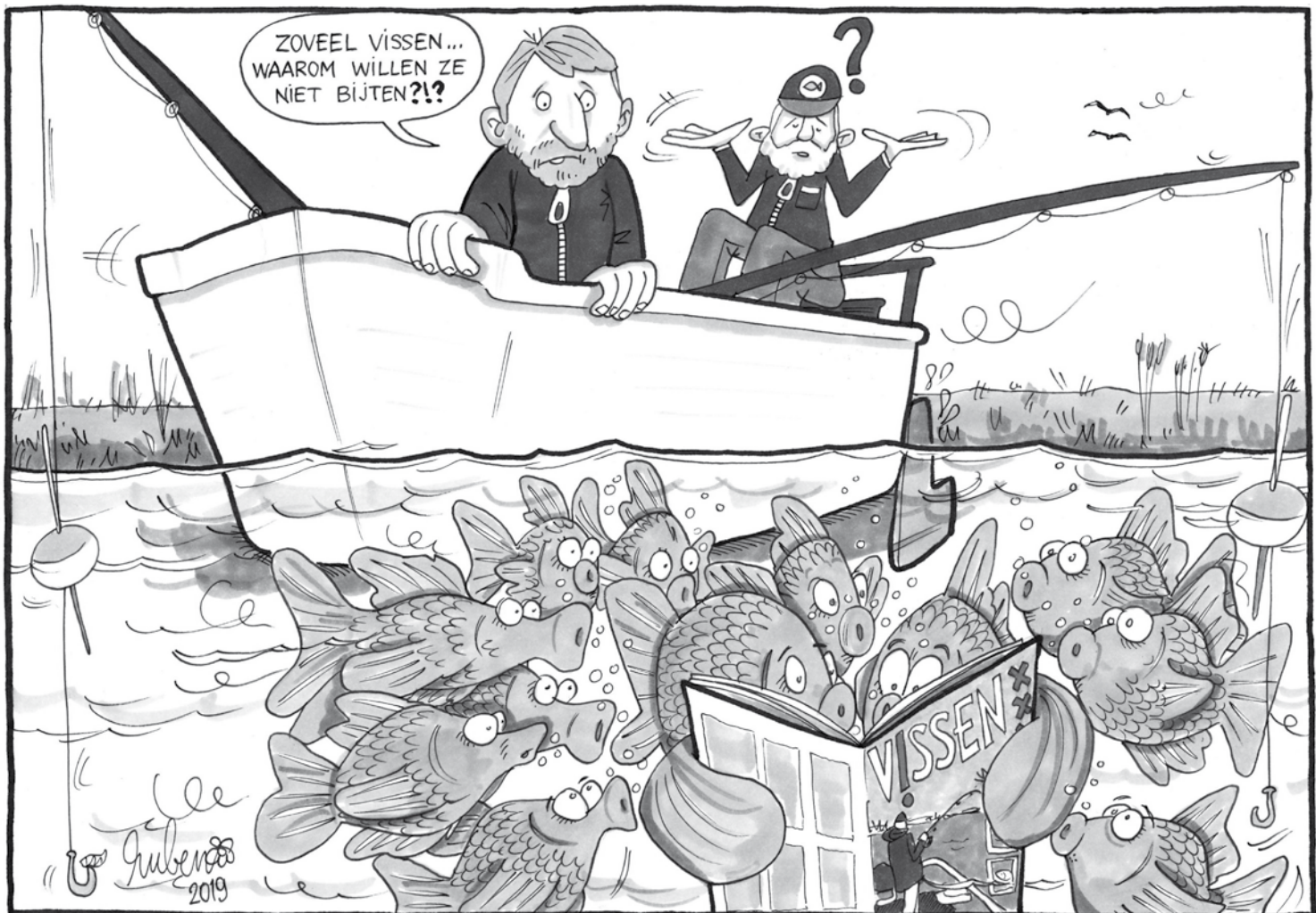
CARTOON: RUBEN VAN AEFST

Als je het zo aanpakt kan het haast niet misgaan. Vergeet ook je Vispas niet mee te nemen. Er wordt regelmatig gecontroleerd en een bekeuring draagt niet echt bij aan je goede humeur. Last-but-not-least adviseer ik je om goede winddichte warme kleding aan te trekken. Twee uurtjes vissen bij drie graden Celsius wil nog wel eens fris aanvoelen. Als je dat ook allemaal voor elkaar hebt ben je er klaar voor. Wij komen elkaar vast wel ergens in Amsterdam en omgeving tegen deze winter.