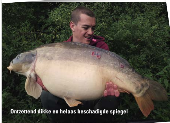
Ontzettend dikke en helaas beschadigde spiegel