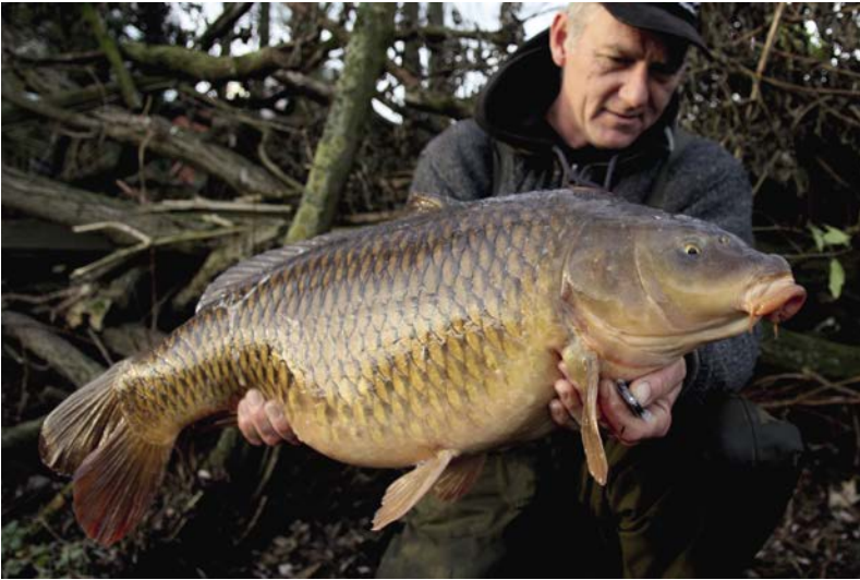
Een winterbommetje, tijdens de dril kwamen 2 karpers 'kijken' wat er aan de hand was