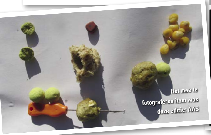
Het mee te fotograferen item was deze editie: AAS