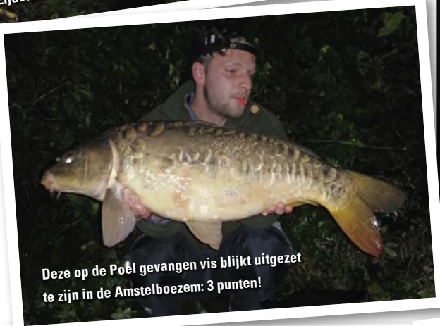
Deze op de Poël gevangen vis blijkt uitgezet te zijn in de Amstelboezem: 3 punten!