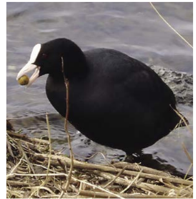
Ook koeten lusten miniboilies

hetgeen je doet. Warme kleding! Laten we daarmee beginnen, niets is vervelender dan vernikkelde tenen en kouwe klauwen tijdens het vissen. Het lijkt een cliché, maar het is te belangrijk om niet te noemen. Ook ik ben wel eens te dun gekleed op karperpad gegaan