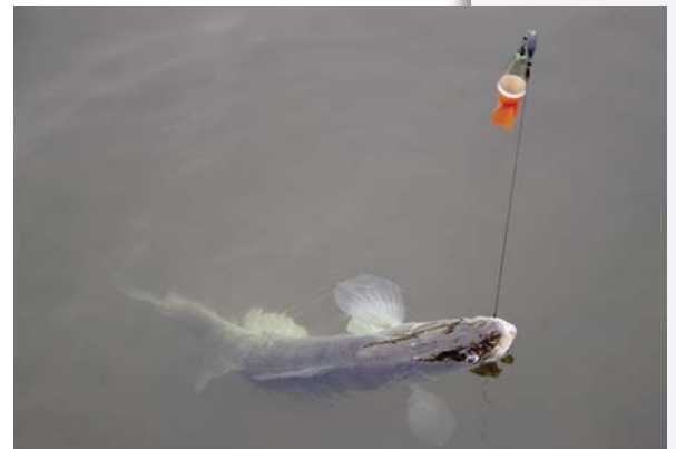
Ook een kans op grote snoekbaars bij het doodazen op snoek!

De roofviscommissie wil beide heren hartelijk danken voor hun mooie en interessante lezingen!