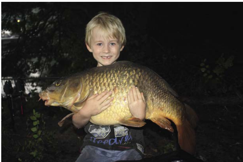
Niet de mooiste schubkarper

2 kilo vanaf van de weegzak: 'Ja tijger, 26 pond, het is je record!' Als een dolle springt en danst hij om de tent, wat is dit gaaf zeg! Tijd voor de foto dan, best lastig nog. Een jochie van krap 20 kilo met een vis van 13 kilo. Emmertje onder zijn bips en een dikke ont-haakmat voor zijn voetjes en goed vasthouden. Het lukt zelfs om een foto van ons samen te maken.