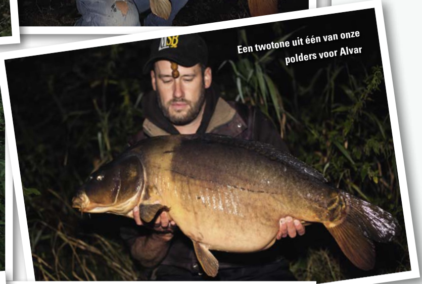
Een twotone uit één van onze polders voor Alvar