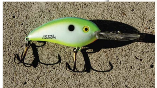
Licht baarsplugje met grote lip

de onderzijde. Hoewel sommige cracks baitcasters gebruiken met een superlicht reeltje bij het gericht snoekbaarsvissen, worden deze hengels meestal toegepast wanneer er met grof kunstaas wordt gevist. Denk dan aan grote jerkbaits, stukken rubber van 30 cm+ en mega-pluggen. Bij het slepen op snoek kan je het best altijd een baitcaster gebruiken, door het continue gebeuk van het kunstaas op je hengel en molen/reel heb je bij een reel minder kans dat de as uit balans raakt doordat deze haaks op de hengel staat. xxx