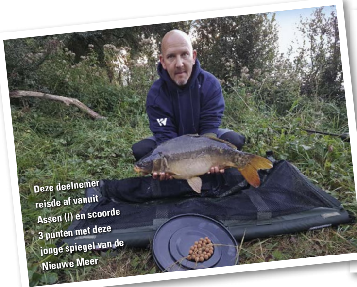
Deze deelnemer reisde af vanuit Assen (!) en scoorde 3 punten met deze jonge spiegel van de Nieuwe Meer

Op 27 november vindt de prijsuitreiking plaats in Het Wapen van Diemen, de deelnemers van de wedstrijd zijn reeds uitgenodigd. Op die dag zal duidelijk worden wie de winnaar is en met de hoofdprijs van Martin SB aan de haal gaat. In de volgende editie van VISSEN een kort verslagje hierover.