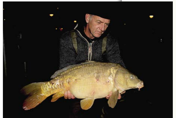
Uit een luw vuilhoekje weggeplukt

dikke kolk in het water en kans verkeken. Heel zuur, maar eigenlijk ook weer niet. De kans is groot dat de vis 5 meter verderop weer op de bodem gaat liggen chillen en het hele voorval allang is vergeten. Sterker nog, om de één of andere reden liggen karpers bij elkaar in de winter, dus laat je er eentje schrikken dan weet je genoeg! Positive thinking.