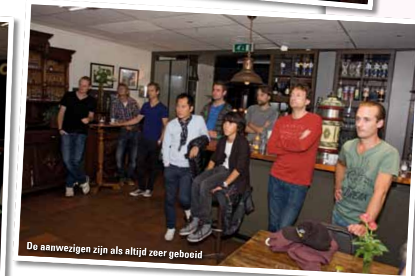
De aanwezigen zijn als altijd zeer geboeid