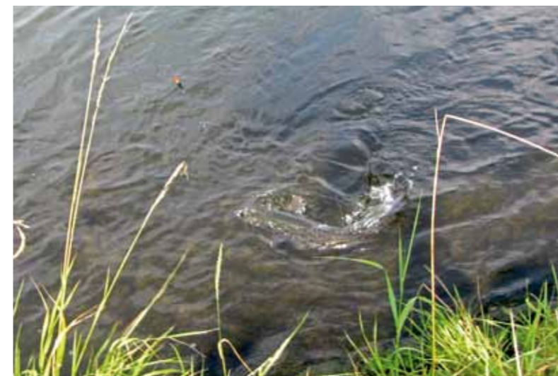
De dril van een harder is spectaculair!

Een groot voordeel is dat je voor deze visserij weinig materiaal nodig hebt. Ik gebruik een drie meter lange spinhengel (10-35 gram) of een lichte karperhengel. Op m'n molentje zit 30/00 nylon en ik maak een onderlijntje van 27/00 fluorcarbon. Haakje Gama-katsu LS-3513F, maatje 6, bleek een goede keus om, verstopt in een vlok brood of een korstje, harders te foppen en te haken. Nicolas vist overigens wel wat lichter: 12/00 gevlochten lijn, 17/00 fluorcarbon onderlijn en een stevig witvishaakje maat 10. Volgens