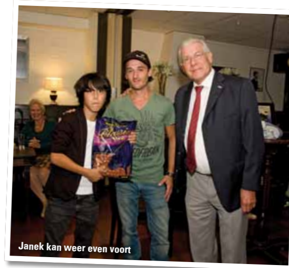
Janek kan weer even voort