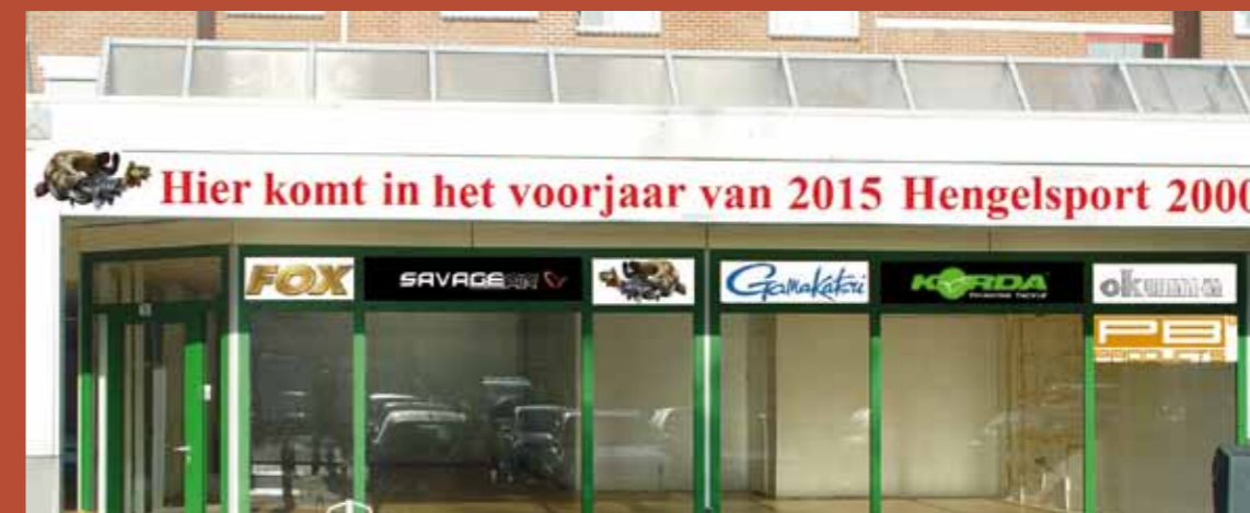
Meer vierkante meters en GRATIS parkeren!

In de volgende editie van VISSEN magazine meer aandacht voor de nieuwe winkel! ***