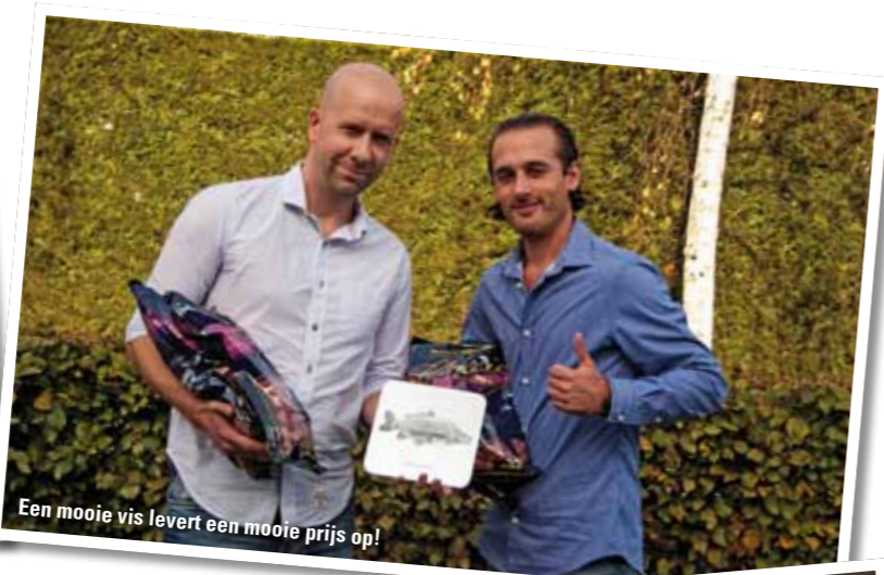
Een mooie vis levert een mooie prijs op!