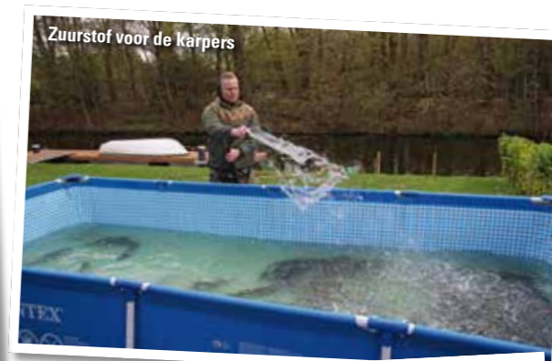
Zuurstof voor de karpers