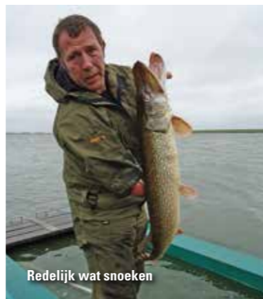
Redelijk wat snoeken