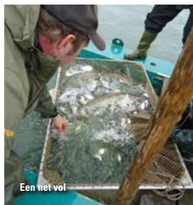
Een net vol