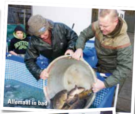
Allemaal in bad