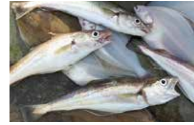
De vis is helemaal los

paternoster. Een onderlijn met twee of drie zijlijntjes met een haak. Een gemiddelde haakmaat zes volstaat. Als model gebruik ik de alom bekende 'Aberdeen'. Soms fleur ik deze zijlijntjes wel eens op met een paar felgekleurde kralen. Zeevissen zijn namelijk reuze nieuwsgierig!