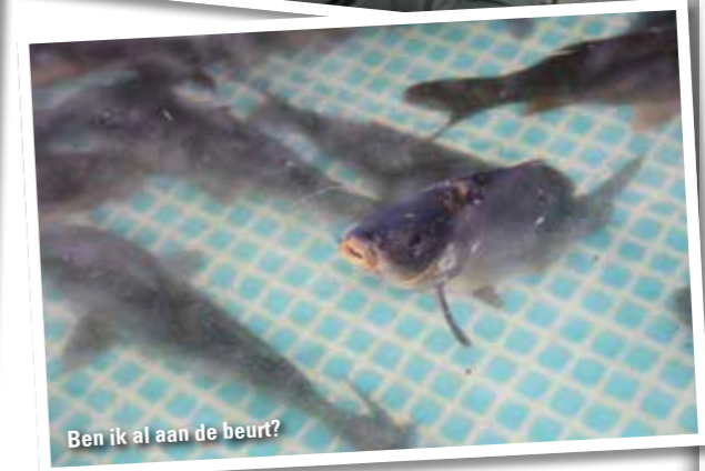
Ben ik al aan de beurt?