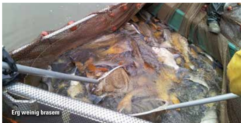
Erg weinig brasem