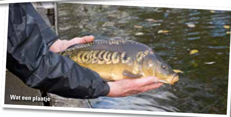
Wat een plaatje