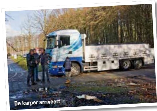
De karper arriveert

De vis werd aan de hand van de door de karpercommissie gehanteerde classificatiemethode over de volgende wateren verdeeld: Sloterplas, Nieuwe Meer, Amstelveense Poel, Zijdelmeer, Derde Diem, Gaasperplas, Ouderkerkerplas en verschillende kleinere watertjes. ***