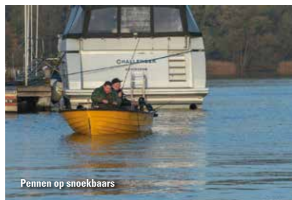
Pennen op snoekbaars