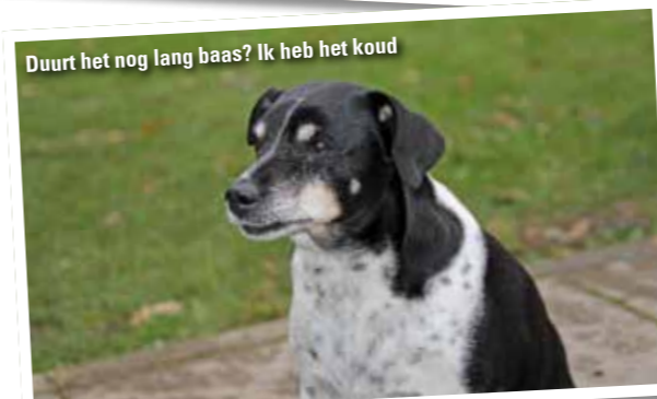
Duurt het nog lang baas? Ik heb het koud