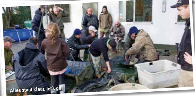
Alles staat klaar, let's go!