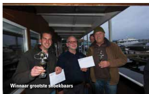
Winnaar grootste snoekbaars