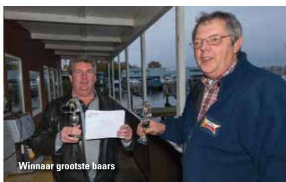
Winnaar grootste baars