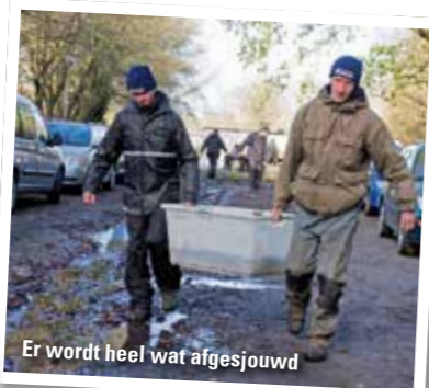
Er wordt heel wat afgesjouwd