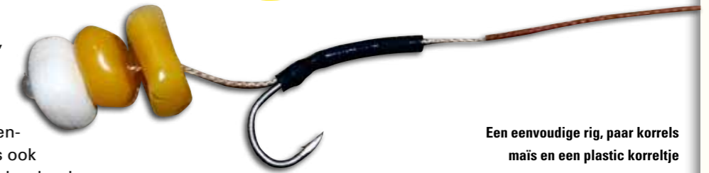
Een eenvoudige rig, paar korrels maïs en een plastic korreltje

Veel karpervissers voeren het liefst een paar dagen voor, in een eerder artikel gaf ik al aan dat je mij ook tot die categorie mag rekenen. Helaas is het voor de meeste vissers gewoon te duur om dit structureel met boilies te