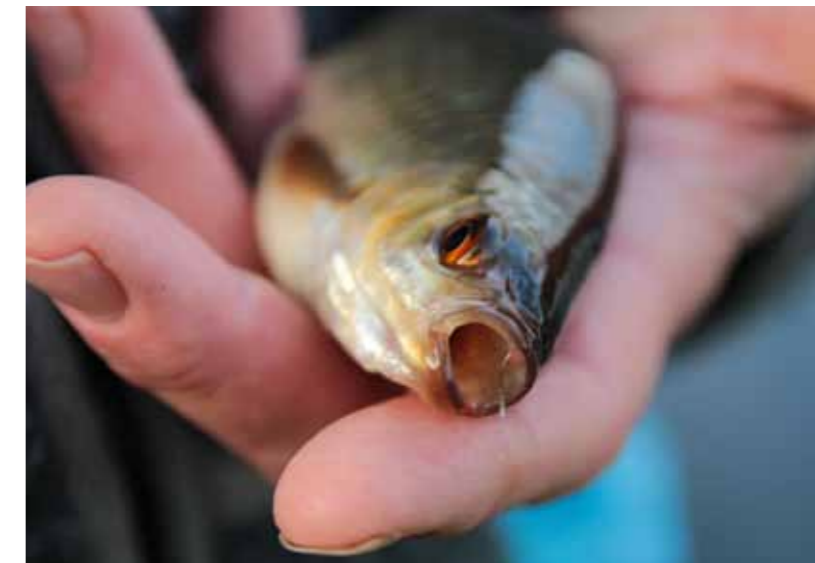
Bovenstandig bekkie, mooi gehaakt

rest onraad ruikt en het hazenpad kiest. Beter is het om eerst een 'vreetorgie' te veroorzaken, hierdoor lijken de vissen de veiligheid uit het oog te verliezen en dat is in ons voordeel.