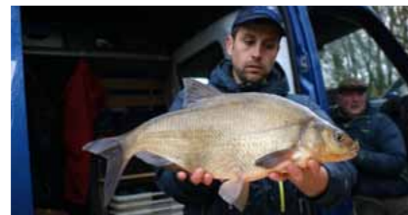
Een bak van een brasem