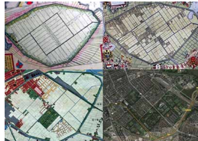
Watergraafsmeer: 1669, 1719, 1920, 2014

Alvar: 'Mijn visavonturen begonnen in mijn vroege kinderjaren. Geboren in Amsterdam-Oost, woonachtig in de Retiefstraat, verhuisde ik enkele jaren later naar de Ringdijk. Aan de naastgelegen Ringvaart bracht ik tot mijn achtste heel wat uurtjes vissend door, op jacht naar de overvloed aan rietvoortjes en baarsjes die zich tussen de lilielieden schuil hielden. Elk voorjaar zag ik er grote ruggen tussen de lilielieden van vissen die ik toen nog niet kende. Tegenwoordig, alweer heel wat jaartjes woonachtig in het noorden van het land, kom ik nog steeds in Amsterdam-Oost dankzij familie en vrienden die er wonen. Spannende struintochten beleef ik dan, op jacht naar die grote ruggen in de wateren van Oost.'