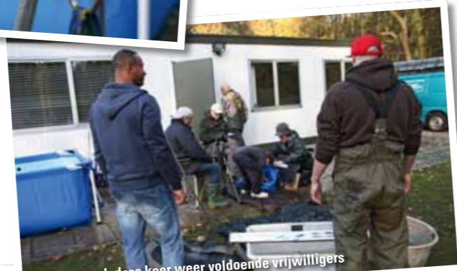
Er waren ook deze keer weer voldoende vrijwilligers