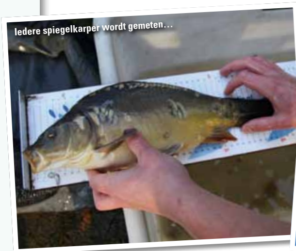
Iedere spiegelkarpers wordt gemeten...