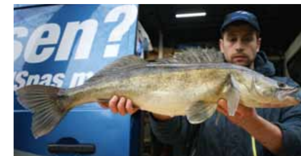
Eén enorme snoekbaars!