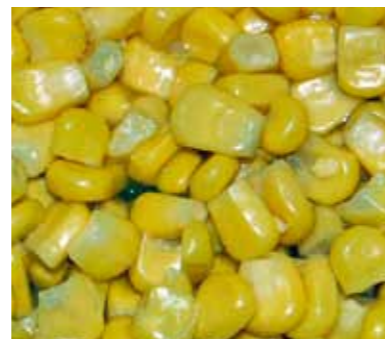
Harde maïs, goed en goedkoop!

Het betreffende water is witvisarm en bovendien is vissen op korte afstand hier geen enkel probleem, dus was mijn vismaat voor het eerst in lange tijd weer eens met maïs gaan vissen. Verspreid over twee dagen had hij totaal vijf kilo gekookte maïs gevoerd en was toen voor een nachtje op zijn plek neergestreken. Dat de gekozen strategie hem geen windeieren opleverde mag wel duidelijk zijn! Op weg naar huis realiseer ik me dat het voor mezelf ook alweer een hele tijd geleden is dat ik serieus met maïs gevestigd heb en dat terwijl ik er vroeger zo goed op ving.