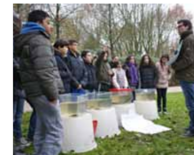
Een leuke buitenles voor de Flevoparkschool!