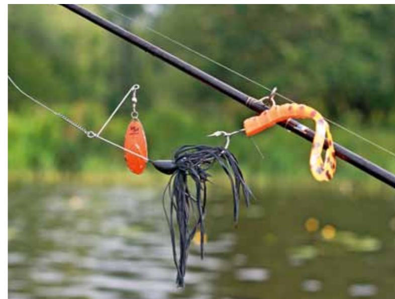
De spinnerbait werkt perfect.