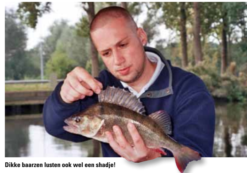
Dikke baarsen lusten ook wel een shadje!

Zelf gebruik ik voor deze techniek graag een licht spinhengeltje van 2.10 meter, maar ik heb ook wel eens een forellenstok of een lichte dropshothengel gebruikt. Er zijn tegenwoordig talloze betaalbare