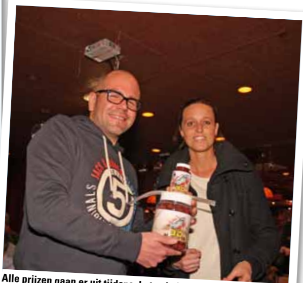
Alle prijzen gaan er uit tijdens de tombola!

De karpercommissie van de AHV wil graag langs deze weg de tombolasponsors Martin SB, Piet Vogel Rods & Tackle, Hengelsport Utrecht en Shimano hartelijk danken voor de prachtige prijzen! Velen gingen huiswaarts met een mooie prijs. De opbrengst van de tombola, maar liefst €450, komt geheel ten goede aan de Belangenvereniging Verantwoord Karperbeheer, BVK! Kortom, een superleuke avond die zeker voor herhaling vatbaar is!