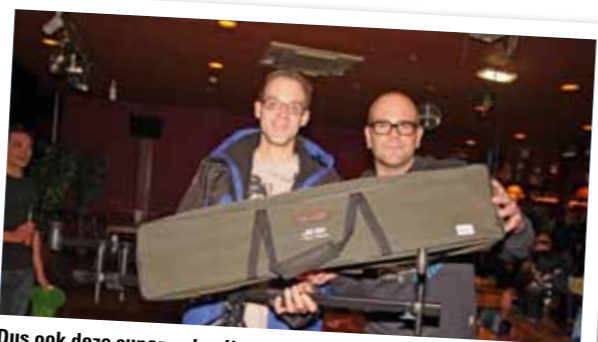
Dus ook deze super rodpod!