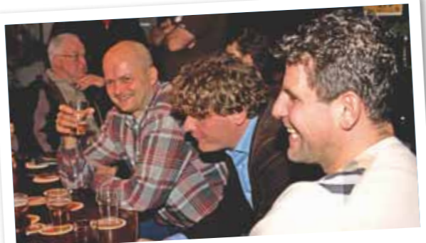
Voldoende stof om even over na te borrelen!