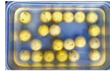
De boilies worden voorgeweekt.

Een water als de Sloterplas wordt veel en intensief bevestigd en ook de vis weet dit natuurlijk als geen ander. Op sommige dagen staan er tientallen tentjes, zie je diverse bootvissers en zijn de karpers vaak in geen velden of wegen te bekennen. Waar zitten ze toch? Niemand vangt wat en als iemand onverhoopt toch actie krijgt, blijft het bij een enkele vis. Het is niet echt mijn ding om dan aan te sluiten bij de meute en lekker tegen