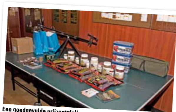
Een goedgevulde prijzentafel!